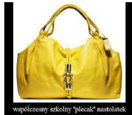
współczesny szkolny "plecak" nastolatek

Matematyka. Jedyne miejsce, gdzie ludzie kupują 60 arbuźów i nikt nie zastanawia się "dlaczego".