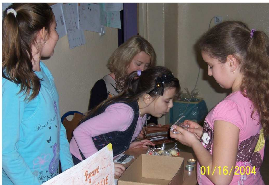
Zdjęcie 1: Uczennice kl. 3 sprzedają własnoręcznie zrobione chińskie ciasteczka z wróżbą.