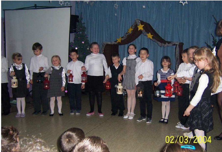
zdjęcie 1: pierwszo i drugoklasiści w kolędzie "Jest taki dzień" zdjęcie 2: scena finałowa jesełek