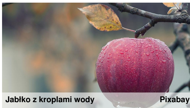
Jabłko z kroplami wody