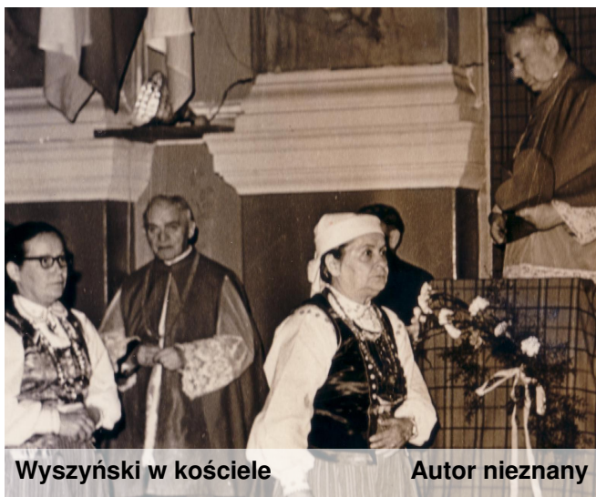
Wyszyński w kościele