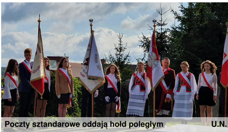
Poczty sztandarowe oddają hołd poległym