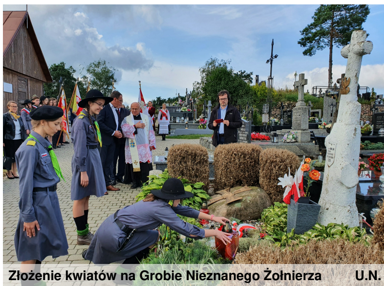
Złożenie kwiatów na Grobie Nieznanego Żołnierza