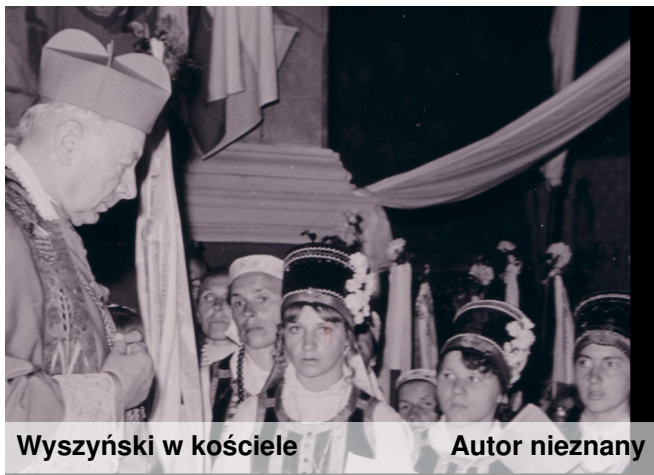
Wyszyński w kościele