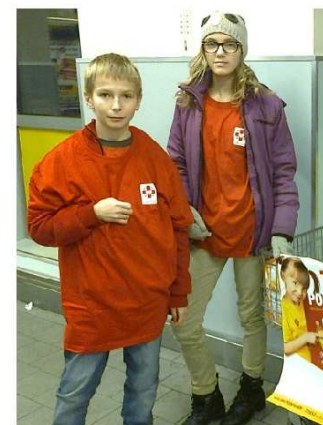
Żeglarska opiekunka szkolnego koła "Caritas".