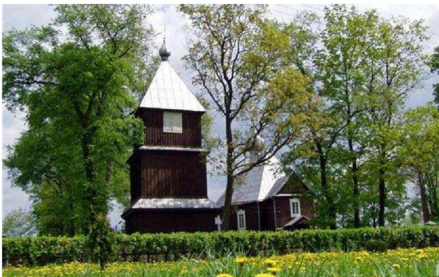
fot. Cerkiew w Orli

Ogromne wrażenie na uczniach jak i jurorach zrobiła makieta orlańskiej cerkwi, którą wykonała Patrycja Szyrenos z klasy III gimnazjum. Jej pracę oceniono najwyżej - zdobyła Grand Prix.