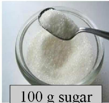
100 g sugar