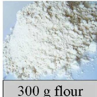
300 g flour