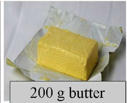
200 g butter