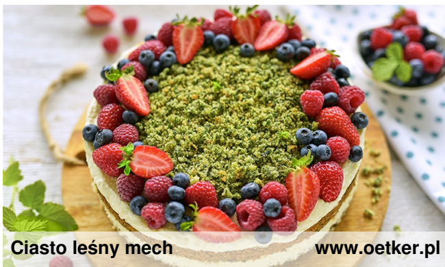
Ciasto leśny mech

Coś słodkiego, coś delikatnego coś pysznego... na wiosnę :)