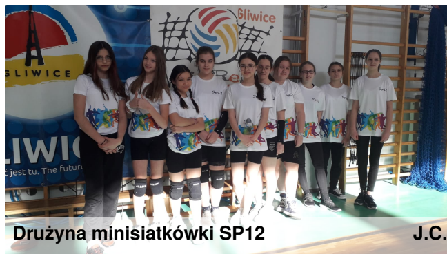
Drużyna minisiatkówki SP12