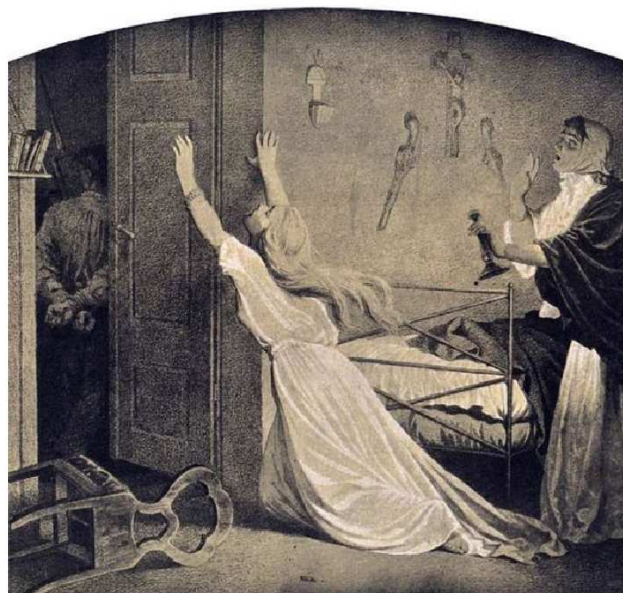
Fragment obrazu Artura Grottgera „Branka”

Pierwszym dyktatorem powstania był Ludwik Mierosławski, następnie Marian Langiewicz, a po nim Romuald Traugutt, który objął dowództwo niewielkiego oddziału powstańczego (ok. 200 ludzi) działającego w powiatach: kobryńskim, prużańskim i brzeskim. W maju 1863 odniósł zwycięstwa w potyczkach pod Herbami i Stolinem, poniósł duże straty broniąc warownego obozu nad Muchawcem. Skierowany na Wotyń, 13 lipca 1863 doznał porażki pod Kołodnem. Awansowany przez Rząd Narodowy do stopnia generała i wysłany z misją wojskowo-dyplomatyczną do Paryża. Po-wrócił przekonany o celowości przedłużenia powstania do wiosny 1864. 17 października 1863, w bardzo niekorzystnej dla powstańców sytuacji, objął władzę dyktatorską, likwidując, rząd czerwonych. Aresztowany przez Rosjan 10 kwietnia i skazany na śmierć.