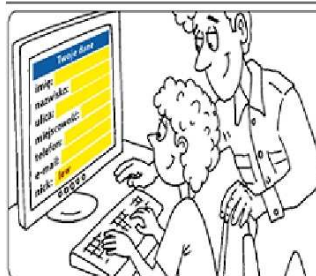
Nie podawaj swoich danych...