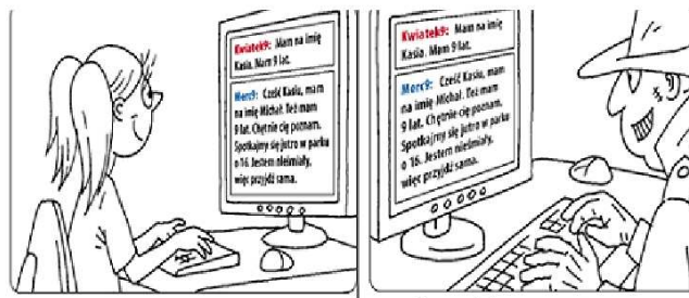
Bardzo ostrożnie zawieraj nowe...

zmienić hasło na swoich kontach internetowych.. Na komputerze koniecznie trzeba mieć zainstalowany program antywirusowy. Obejrane filmy animowane pokazały, co należy zrobić, gdy staniemy się