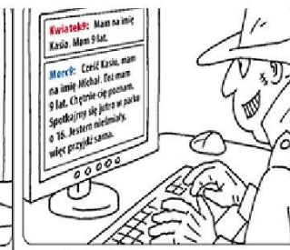
...znajomości przez Internet.