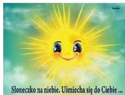
Słoneczko na niebie. Uśmiecha się do Ciebie ...

SŁOŃCE TO CUD NATURY NIECHAJ NAM BARDZO DŁUGO ŚWIECI, CZY TO WIOSNĄ, CZY INNĄ PORĄ ROKU ZAWSZE GO POTRZEBUJEMY!