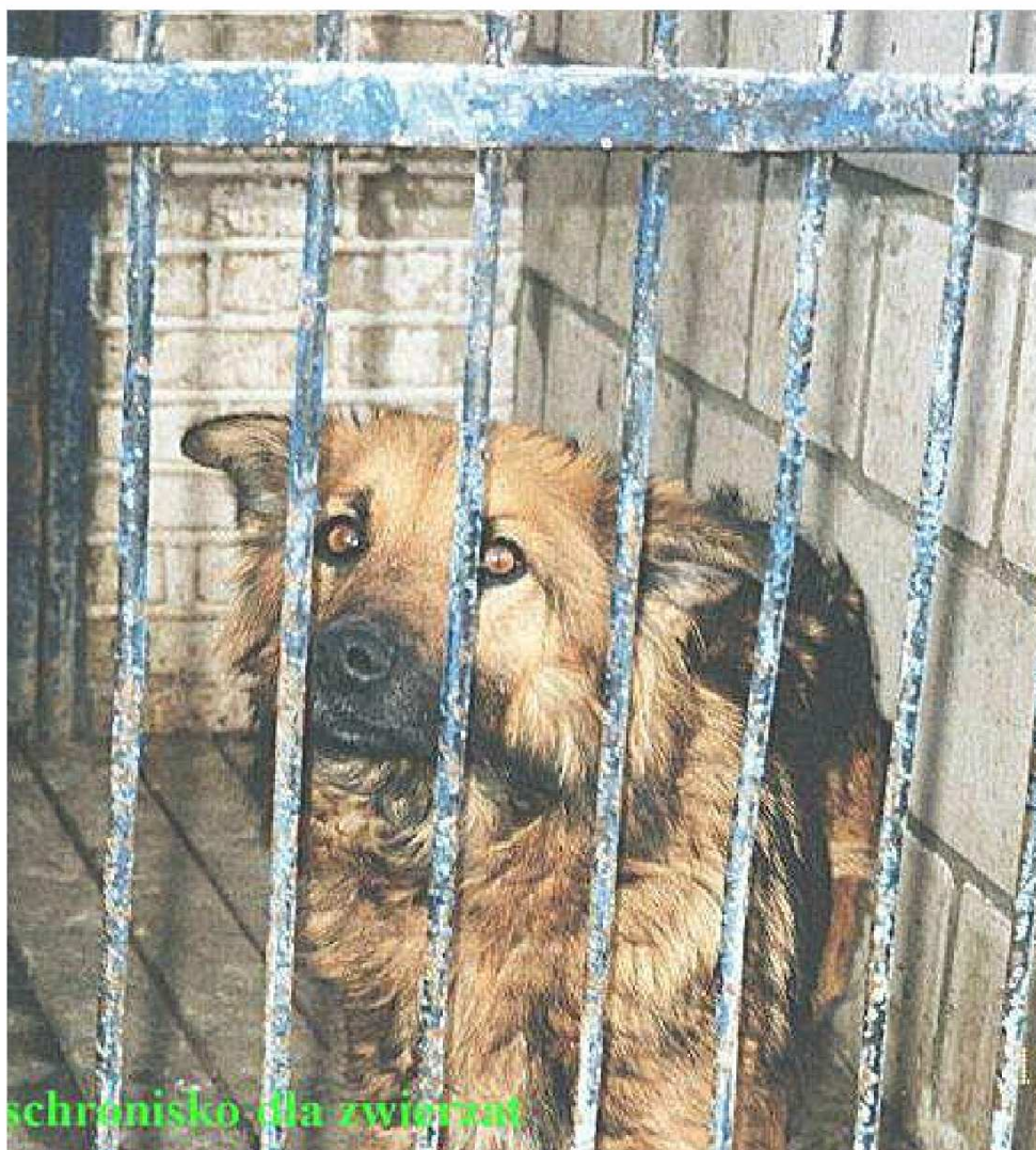
schronisko dla zwierząt

"Pieski los" czyli inaczej kiepski los psów. Na zdjęciach widać psy, które są pozamykane w klatkach gdzie nie mają odpowiednich warunków do życia. W klatkach mają mało miejsca nie mają bud i mokną na deszczu. Przeraziło nas, do jakiego stopnia człowiek biorąc pod swoją opiekę zwierzę, może je