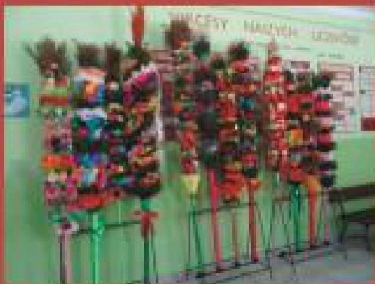
Klasowy konkurs na palmę wielkanocną i nasza obecność na Mszy Świętej w Niedzielę Palmową