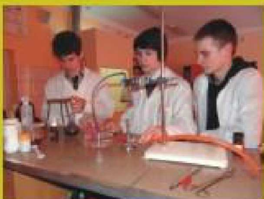
Pokazy chemiczne naszych uczniów podczas Tygodnia Nauk Ścisłych