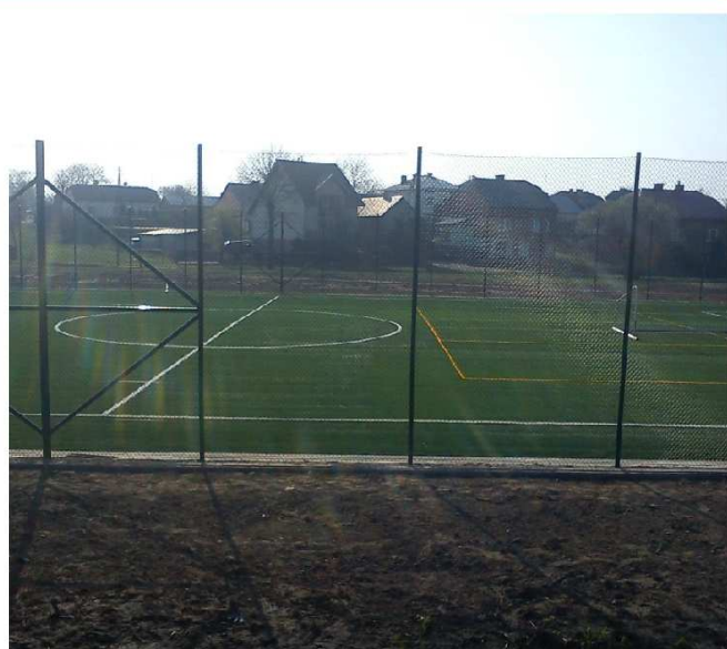
Boisko „Orlik” w Rakszawie Środkowej

Było budowane prawie przez rok.... Pilnie obserwowaliśmy pole budowy. Najpierw teren został odpowiednio przygotowany,