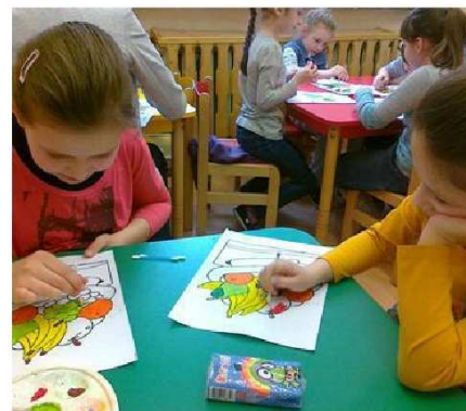
foto. dzieci ze świetlicy malują patyczkami