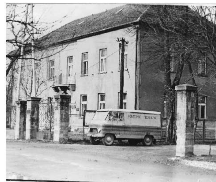
ZSZ im. św. Kingi w Podegrodziu