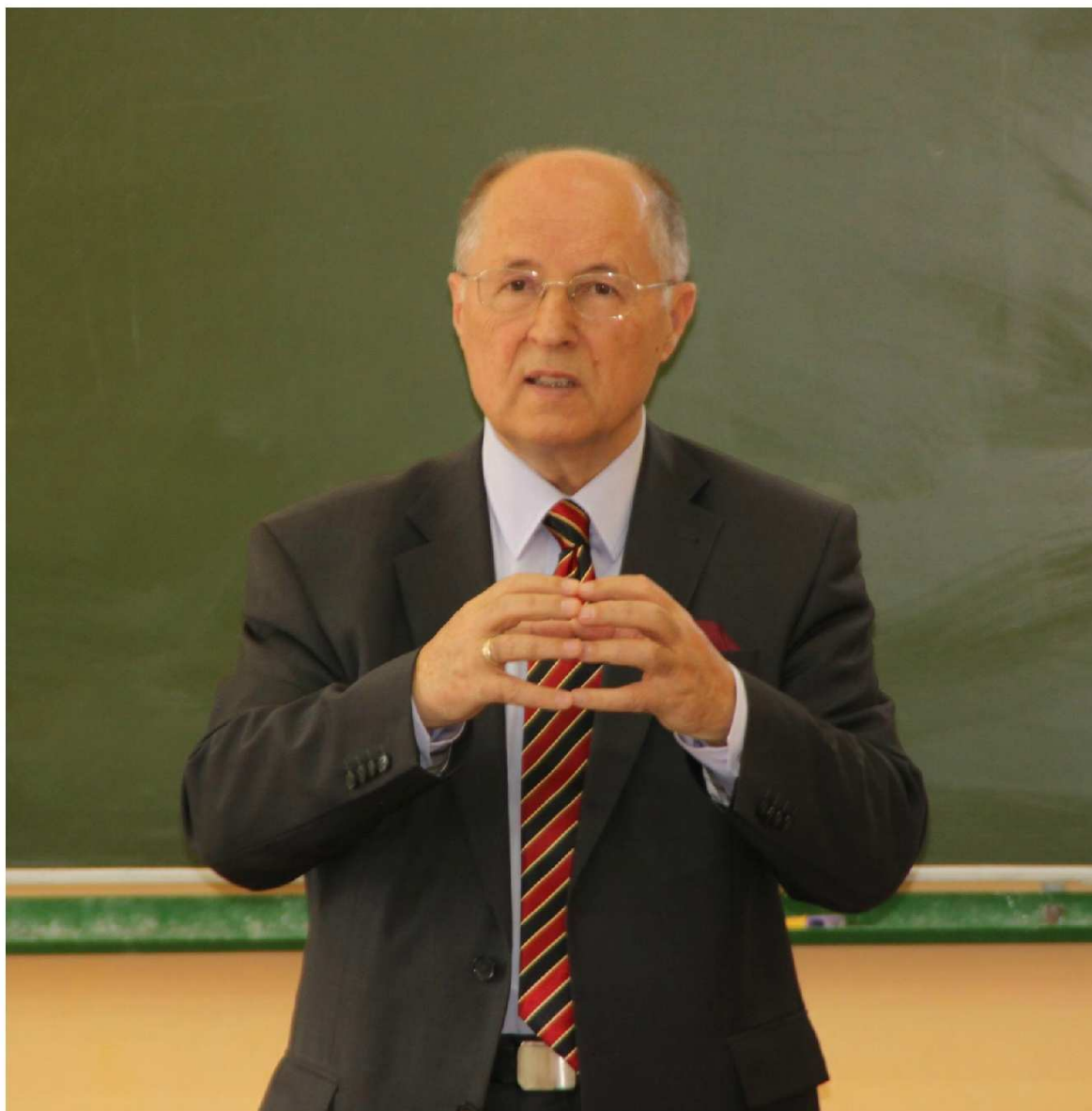
U góry: Senator Michał Seweryński.

Po prawej: Młodzież gimnazjalna podczas spotkania z senatorem.