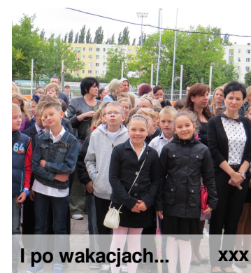
I po wakacjach...

W tym roku rok szkolny zaczął się w poniedziałek 2 września. We wtorek zasiądziemy w szkolnych ławkach i odbędziemy pierwsze lekcje. A potem kolowrotek ruszy, zaczną się zadania domowe, klasówki, dostaniemy pierwsze oceny. Oby dobre!