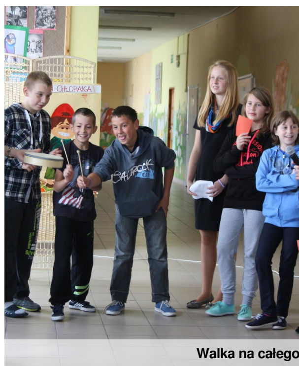
Walka na całego