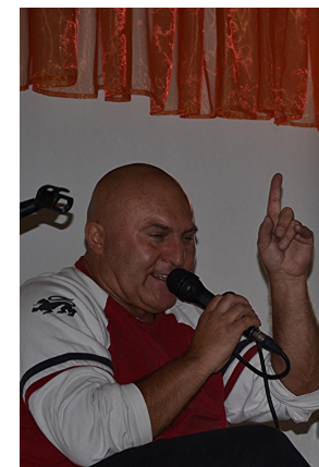
Miło spędzony czas