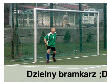
Dzielny bramkarz ;D