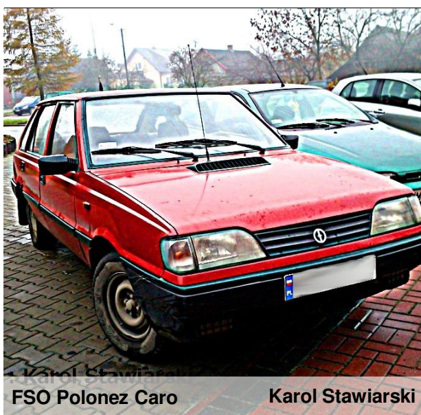
FSO Polonez Caro