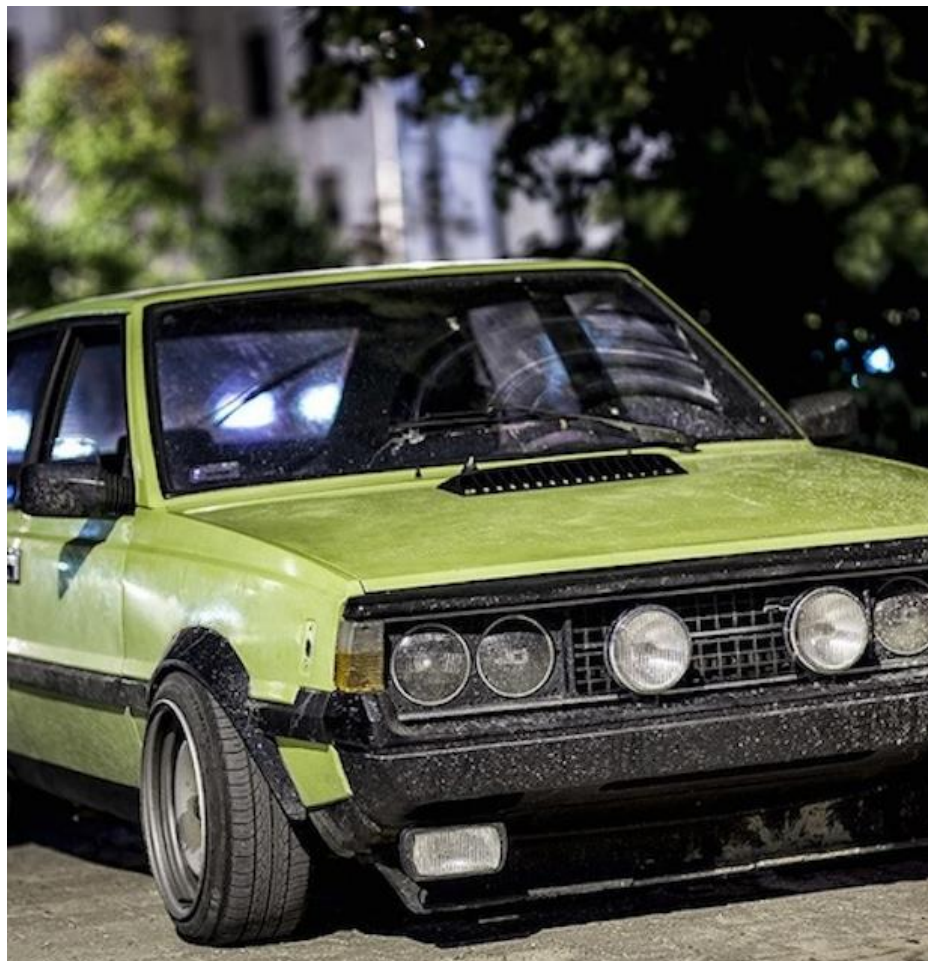
FSO Polonez Borewicz 1986

Z pierwszego zdjęcia wynika, że tak nie jest. Jest to polonez z silnikiem od golfa mk 3 o mocy 250 km.