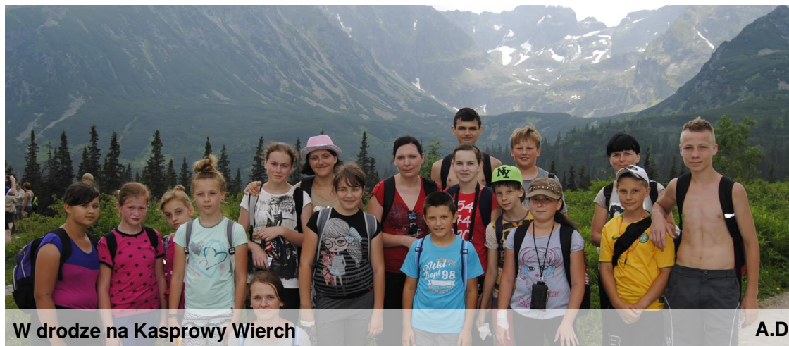
W drodze na Kasprowy Wierch A.D