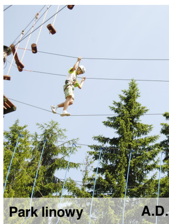
Park linowy A.D