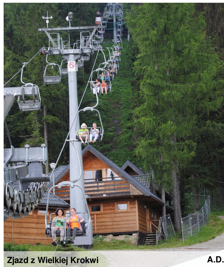
Zjazd z Wielkiej Krokwi A.D