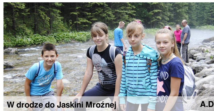
W drodze do Jaskini Mroźnej