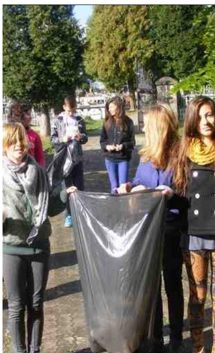
Akcja sprzątania świata.. W.P