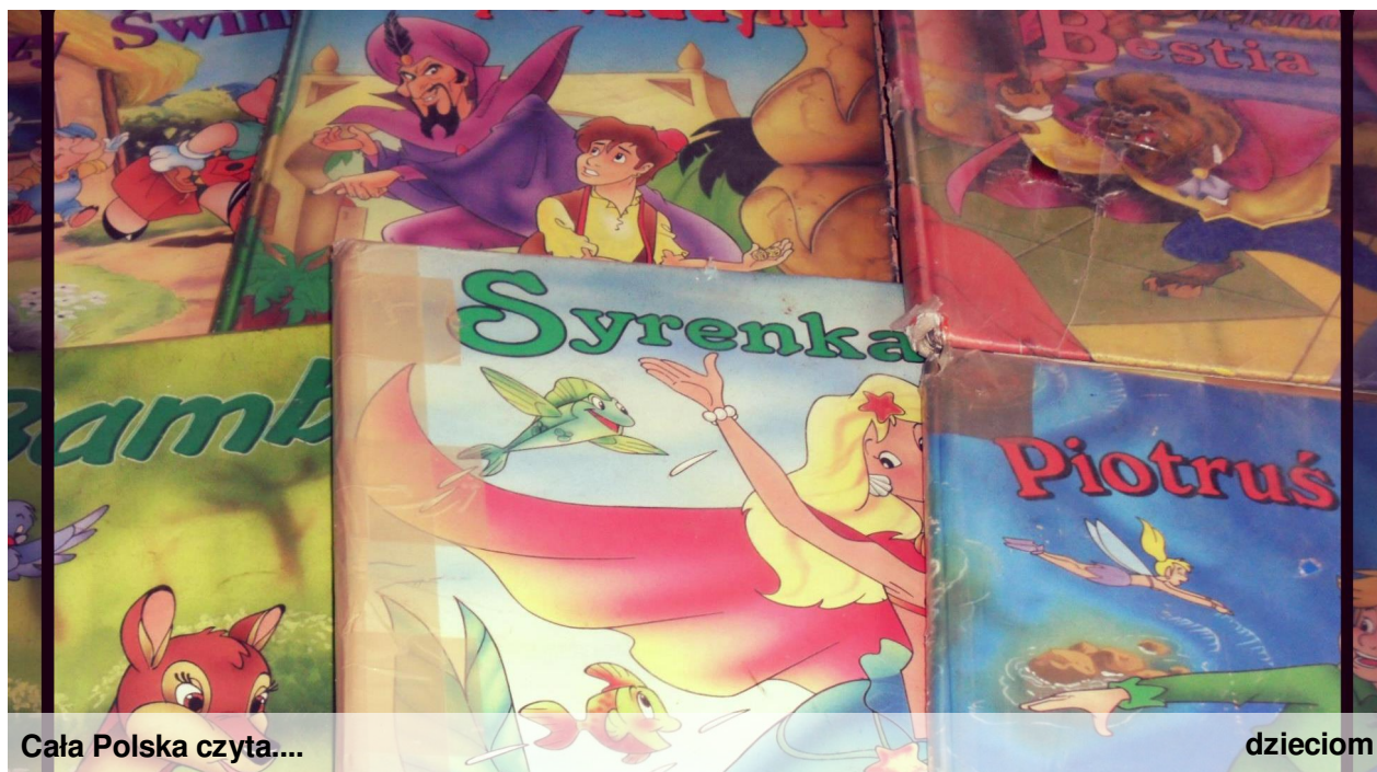
Cała Polska czyta...