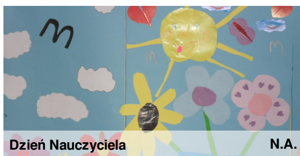
Dzień Nauczyciela N.A.