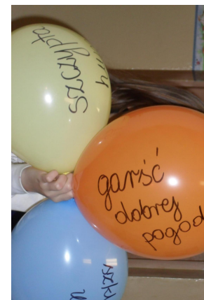
Recepta na nudę