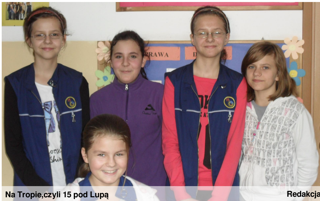
Na Tropie, czyli 15 pod Lupą

Witamy po wakacjach w nieco okrojonym składzie. Część naszych dziennikarzy została już uczniami gimnazjum. Życzymy im powodzenia w nowych szkołach. Jeśli ktoś z Was chciałby dołączyć do naszej redakcji, serdecznie zapraszamy na zajęcia we wtorki o godzinie 13.30.