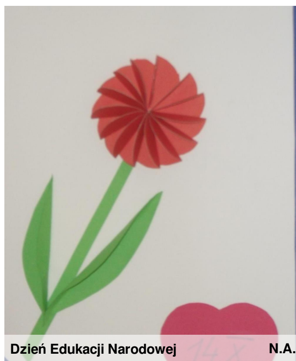
Dzień Edukacji Narodowej N.A.