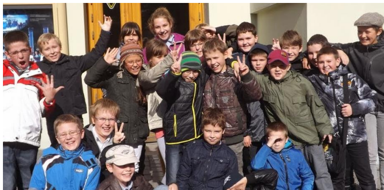
Uczniowie SP 4