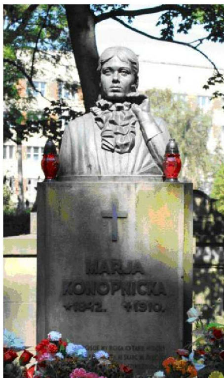
fot. Pomnik Marii Konopnickiej

Cmentarz Łyczakowski z Cmentarzem Orłąt.