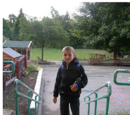
fot. Tak wyglądają mundurki szkolne

6. Jak wyglądały sale lekcyjne Sale są podobne do naszych, ale z każdej sali było wyjście do ogródka szkolnego. W poniedziałek otrzymywaliśmy