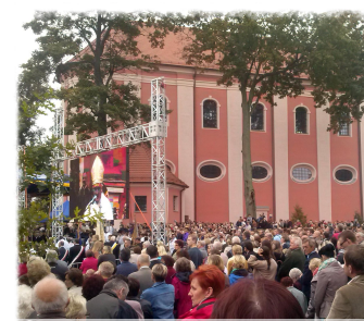
Przed bazyliką

W niedzielę, 15 września tłumy ludzi zebrały się na placu pod sanktuarium w Skrzatuszu (powiat pilski), by uczcić 25-lecie koronacji skrzatuskiej Piety koronami papieskimi. Uroczystości przewodniczył kard. Kazimierz Nycz. Było to wielkie święto diecezji.