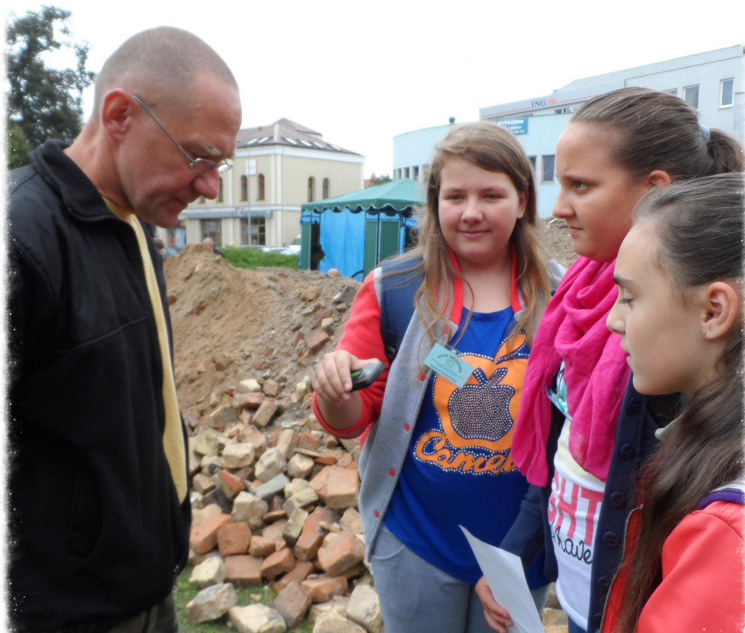
Redakcja podczas wywiadu

Czy badania prowadzone przez Muzeum Okręgowe w Pile zmieniają wiedzę o historii?