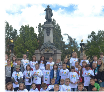
Przed Adasiem S. D.

Prawie 600 uczestników wyruszyło 19. września 11 autokarami na dwudniową wycieczkę do stolicy. Wyjazd zorganizowano dzięki Fundacji 500-lecia Miasta Piły, współpracy z UM i Starostwem Powiatowym w Pile.