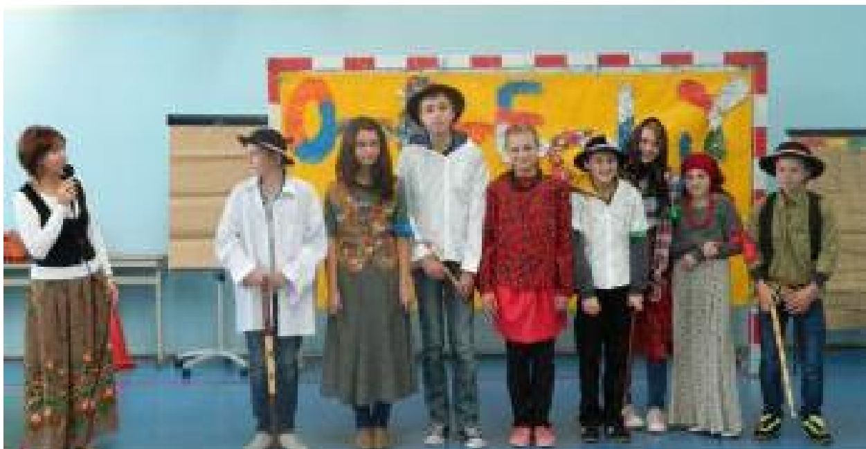
Harcerskie otrzęsiny klas pierwszych