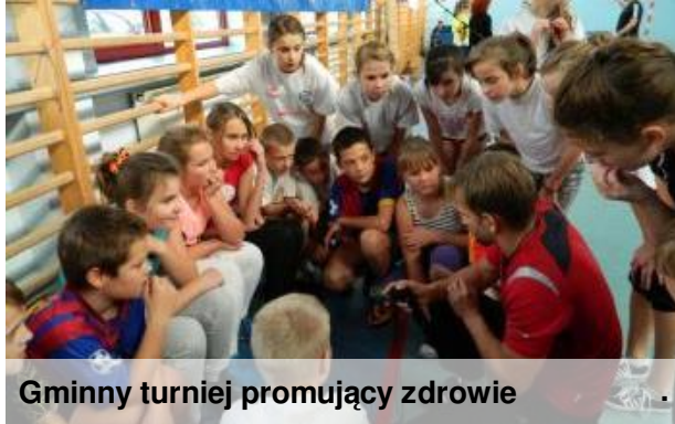
Gminny turniej promujący zdrowie