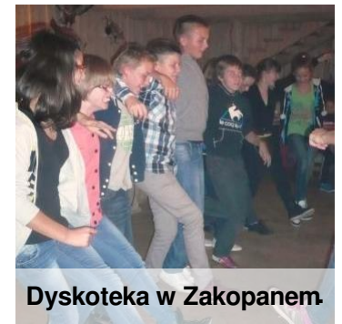
Dyskoteka w Zakopanem

Dziennik Łódzki | Numer 1 01/2014 | Strona 2