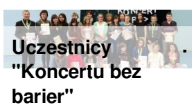
Uczestnicy "Koncertu bez barier"