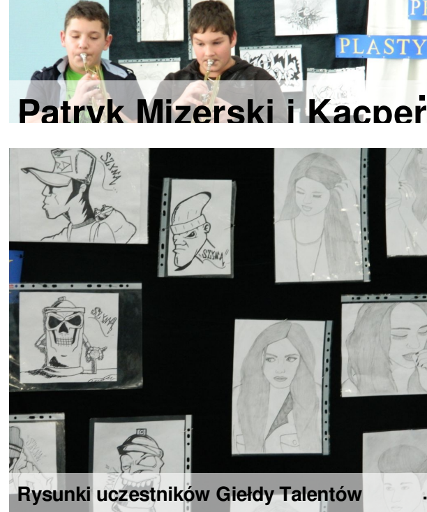
Rysunki uczestników Giełdy Talentów