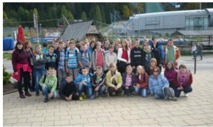
Grupa wycieczkowiczów pod Wielką Krokwią. Dla wielu z nas spacer u stóp obiektu sportowego znanego z telewizji był ogromną atrakcją.

Uświadomiliśmy sobie, jak bogate w wydarzenia są dzieje Polski i jak dużo w nich sukcesów, ale i tragicznych epizodów. Wróciliśmy do domów mądrzejsi i bardziej świadomi, kim jesteśmy. Wędrówka SZLAKIEM PIASTÓW została sfinansowana z dotacji MEN w ramach projektu "Bezpieczna i przyjazna szkoła", toteż mogli w niej uczestniczyć wszyscy, którzy wyróżniają się wzorową postawą. Było świetnie! Czekamy na kolejne wyprawy - w inne regiony Polski.