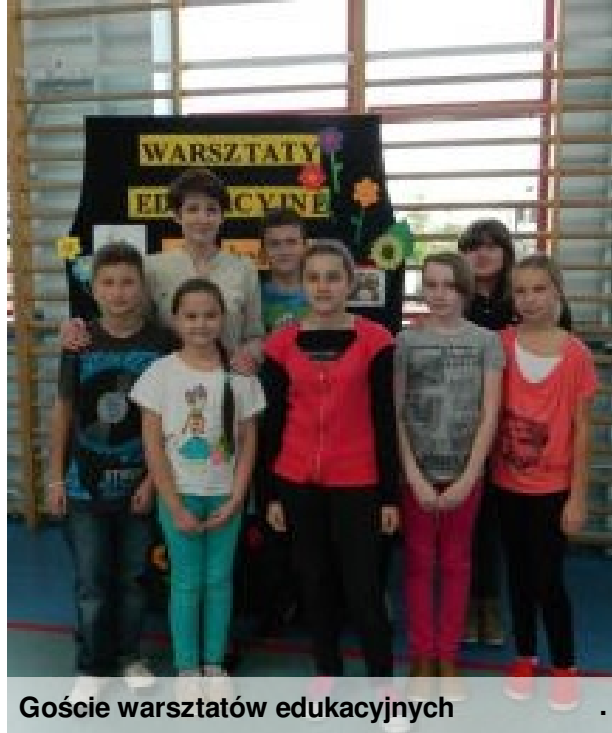
Goście warsztatów edukacyjnych