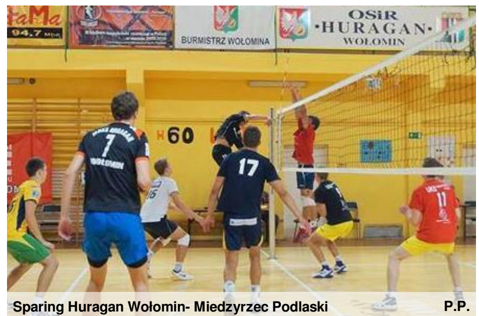
Sparing Huragan Wołomin- Miedzyrzec Podlaski