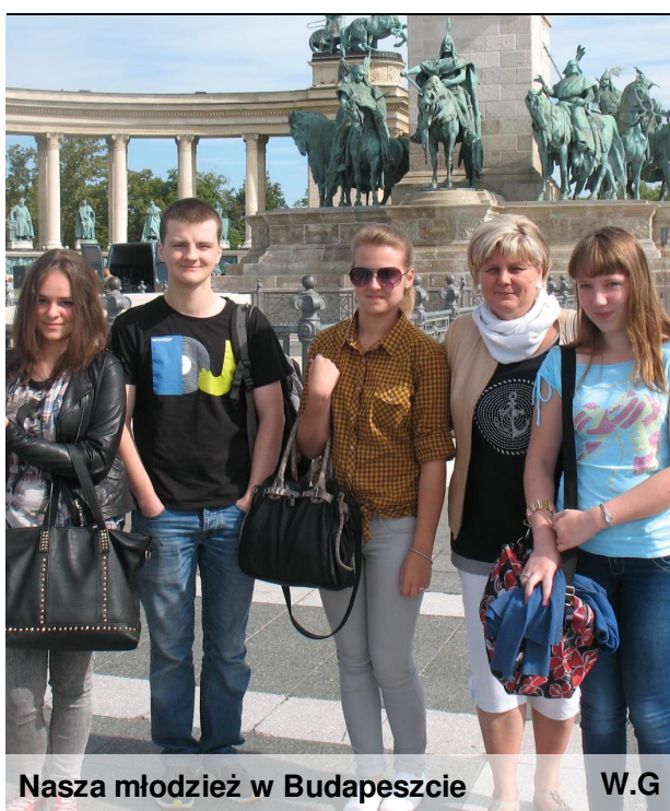
Nasza młodzież w Budapeszcie