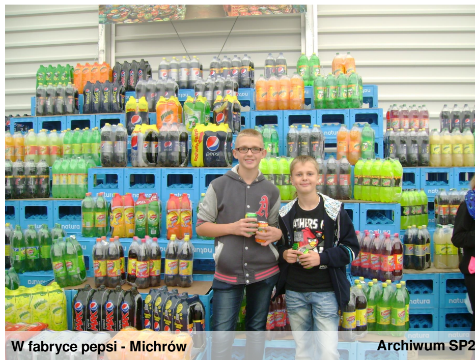
W fabryce pepsi - Michrów