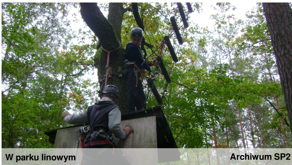
W parku linowym