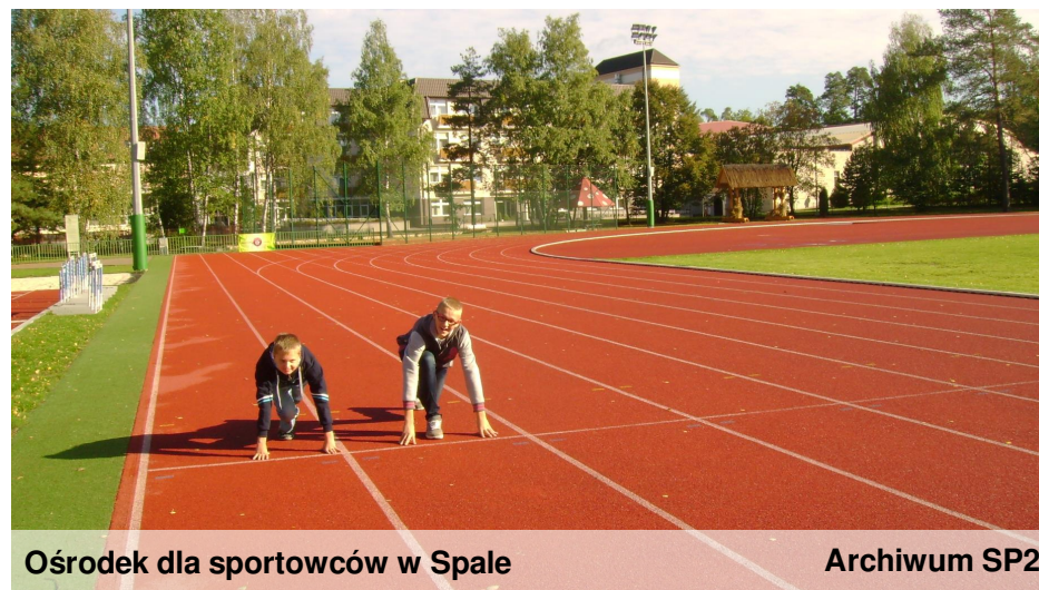
Ośrodek dla sportowców w Spale