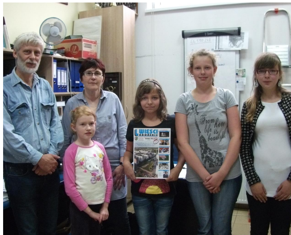
Dziennikarze SP2 w redakcji WL

Serdecznie dziękujemy za spotkanie i ciekawe podpowiedzi.