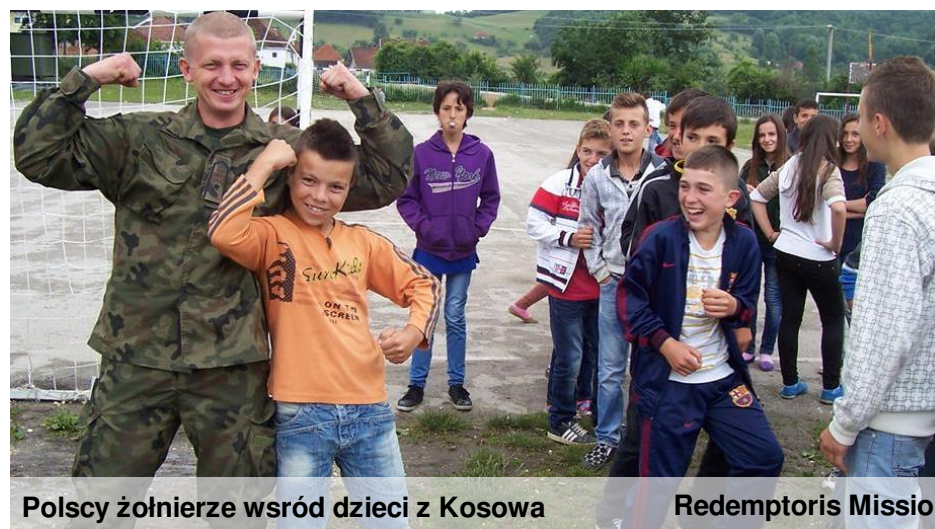
Polscy żołnierze wśród dzieci z Kosowa