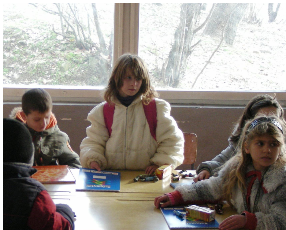
W jednej ze szkół w Kosowie