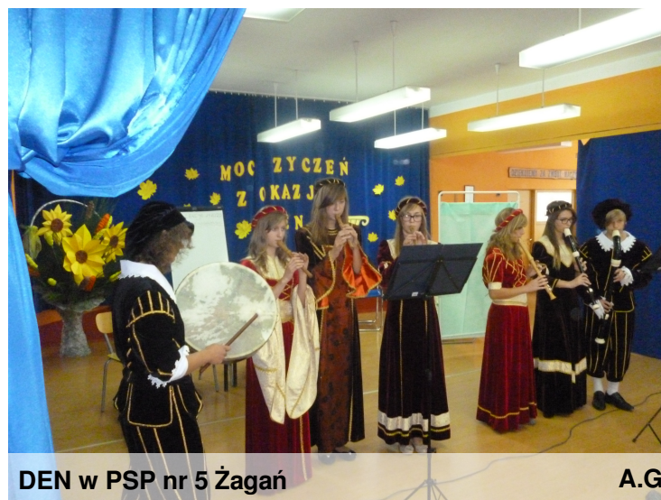
DEN w PSP nr 5 Żagań

Jest to święto całej społeczności szkolnej- nauczycieli, uczniów i personelu niepedagogicznego. Z tej okazji 10 października w naszej szkole odbył się uroczysty apel. Uczniowie przygotowali wspaniały, pełen humoru występ. Młodzi aktorzy okazali się znakomici i sprawili, że na twarzach zgromadzonych w sali gości pojawił się uśmiech i łyż wzruszenia.