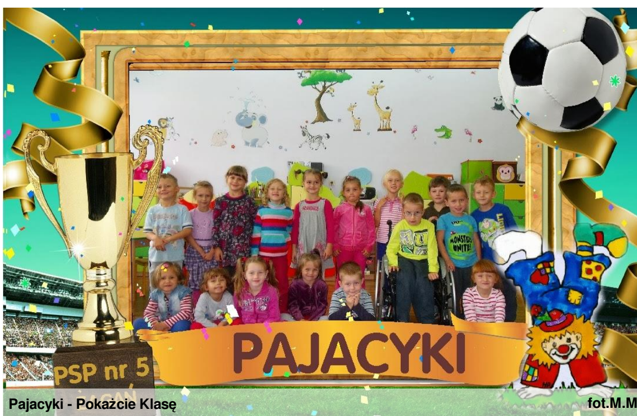
Pajacyki - Pokażcie Klasę