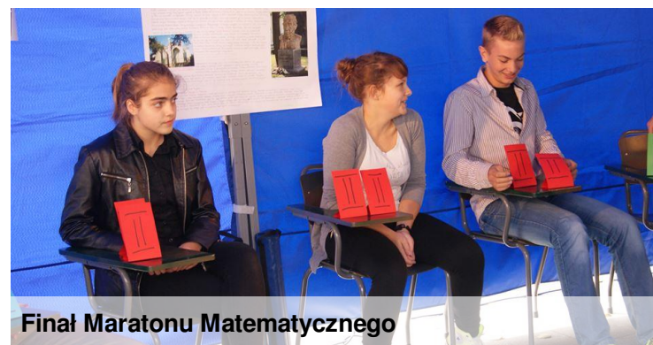
Finał Maratonu Matematycznego