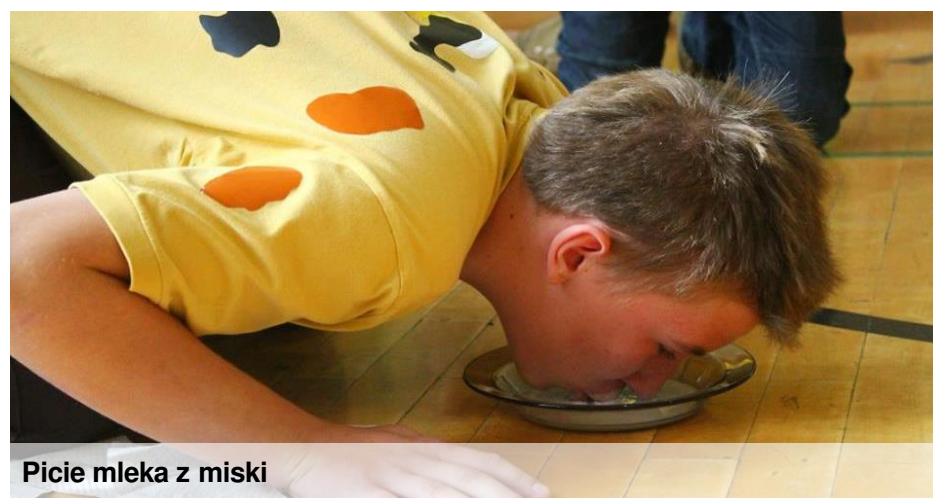
Picie mleka z miski