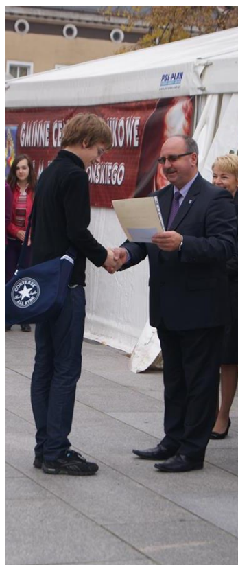
Burmistrz Wolsztyna z finalistami konkursu