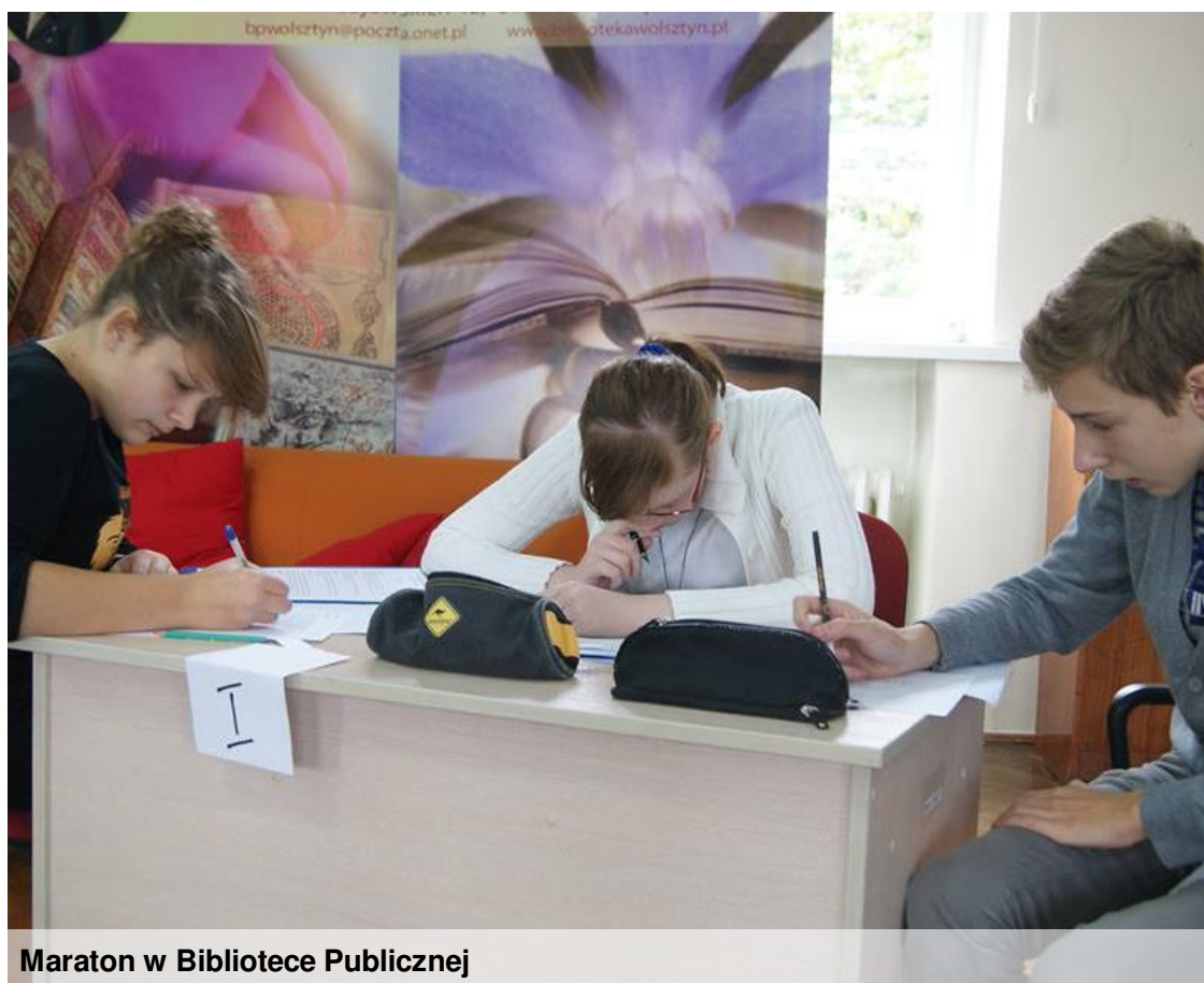
Maraton w Bibliotece Publicznej

piknik został zorganizowany gminny maraton matematyczny, którego finał odbył się właśnie na tym pikniku. Eliminacje do finału zostały zorganizowane w Bibliotece Publicznej, w których wzięło udział osiem drużyn z czterech gimnazjów. W skład każdej drużyny wchodził pierwszoklasista, drugoklasista i trzecioklasista. Rozwiązowali w grupach cztery testy z zadaniami, a na koniec każdy z uczestników otrzymał własny test, na który miał 30 minut. Ostatecznie do finału przeszły 3 zespoły: grupa z Gimnazjum nr 1 i dwie grupy z Gimnazjum z Obry.