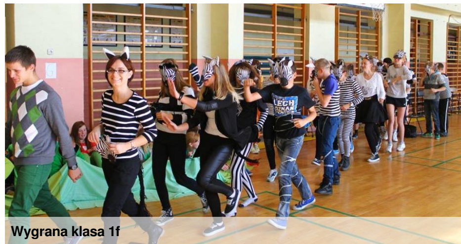
Wygrana klasa 1f

niej w przyszłym roku będzie należała przyjemność organizowania „Chrzstu Kota”.