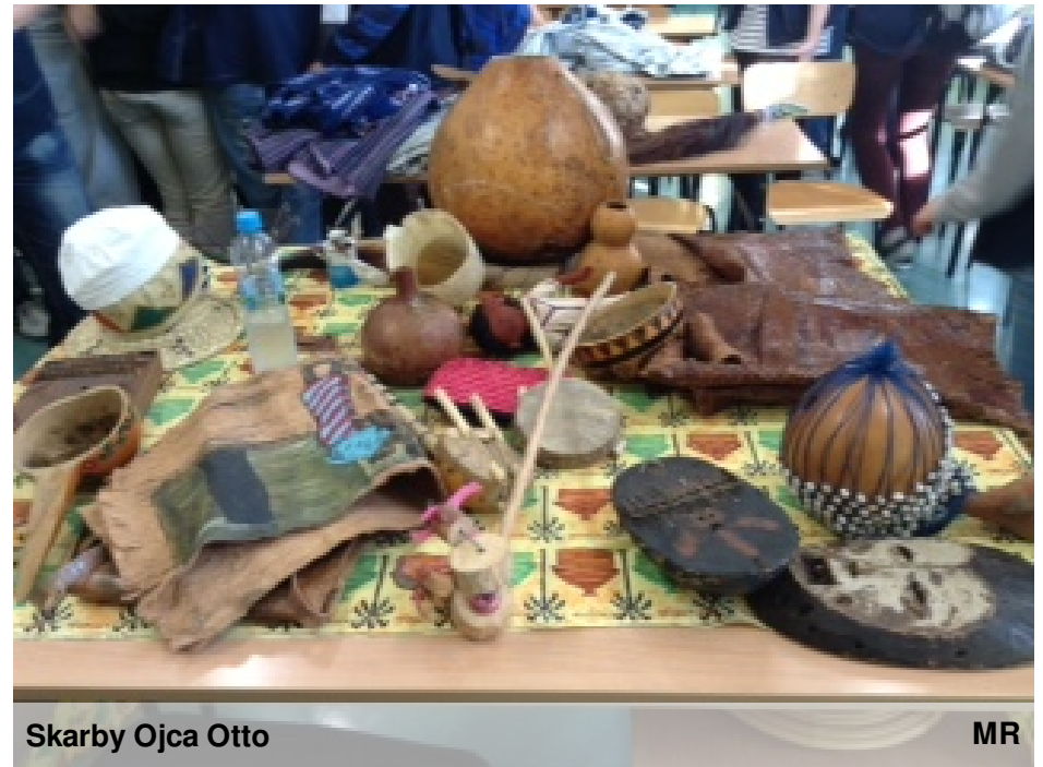
Skarby Ojca Otto