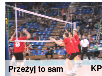
Przeżyj to sam KP