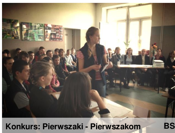
Konkurs: Pierwszaki - Pierwszacom BS