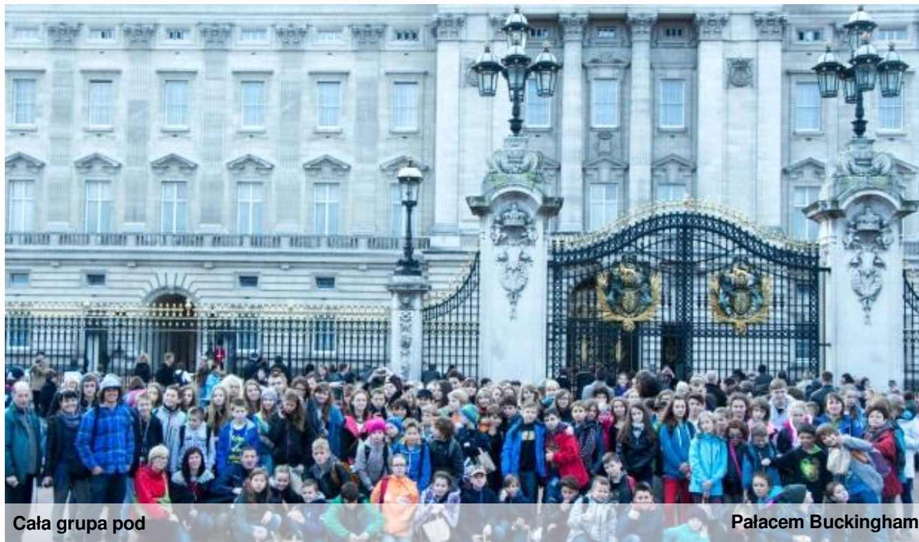
Cała grupa pod