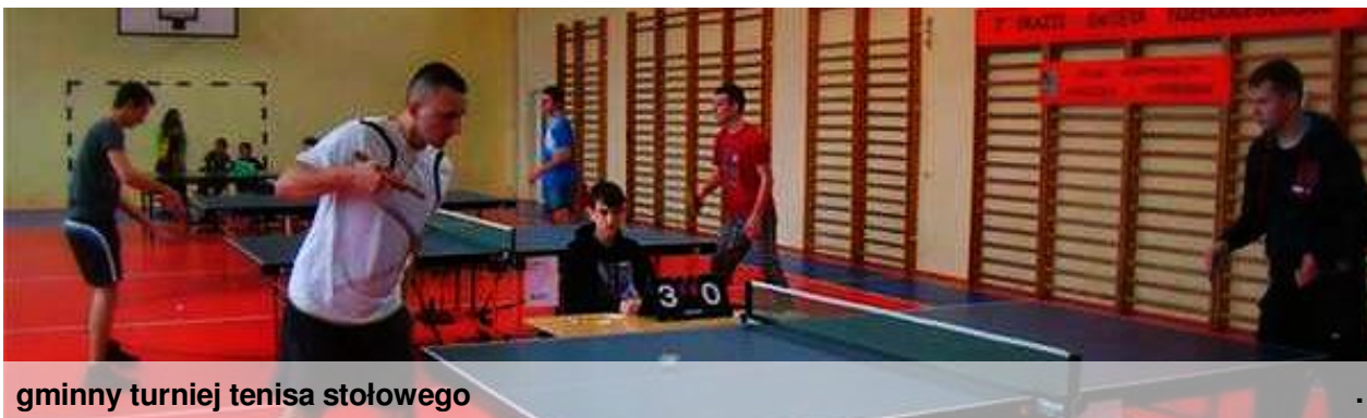
gminny turniej tenisa stołowego