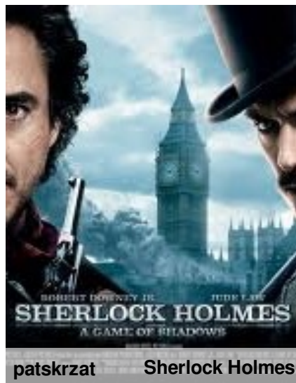
patskrzat Sherlock Holmes

Big Ben - this name often refers to the clock and the clock tower. In fact it is a nickname of the great bell of the clock. The clock tower is called Elizabeth Tower. It is a part of the Palace of Westminster in London, and it is next to the Westminster Bridge. Big Ben is one of the most popular symbols of London. When you see it in the film you know that the action takes place in London. It's beautiful. Just look at the picture by:.)