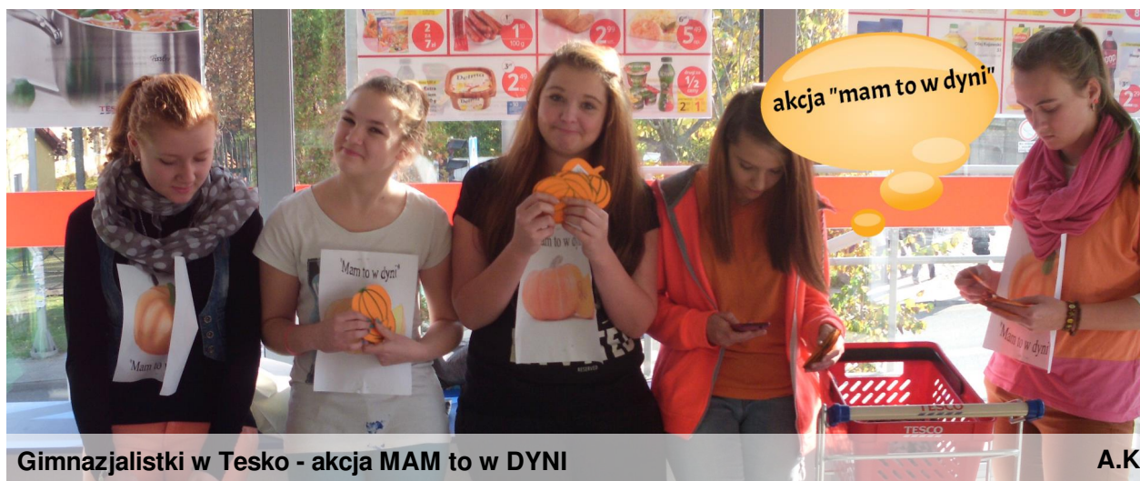
Gimnazjalistki w Tesco - akcja MAM to w DYNI