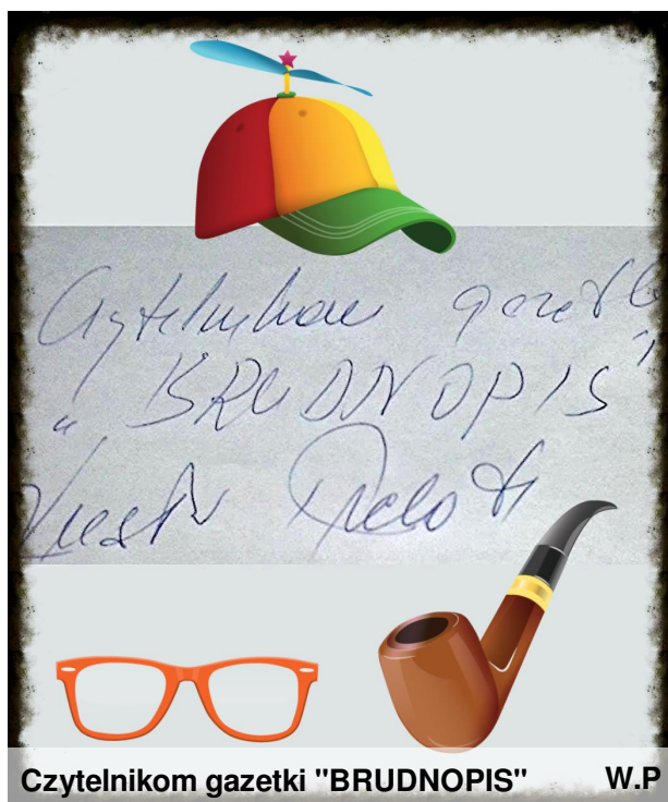
Czytelnikom gazetki "BRUDNOPIS"