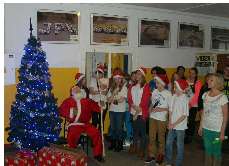
św. Mikołaj i klasa Ia