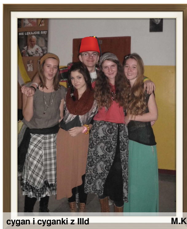
cygan i cyganki z III d