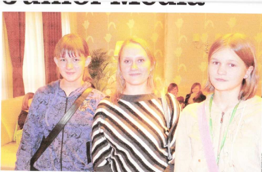
Ponad trzyseto uczniów wzięło udział w warsztatach dziennikarskich, które zaprezentowali adeptomatunkidziennikarskie. Opowiedzieli, jak ścieżkę tatów Junior Media. Wykłady to nie wszystko. Otm. w iaki sposób nowsta- w Hotelu Borowiecki. Gotowy plik ze stroną na formacie pdf należy prze-

12 stycznia 2011 roku w hotelu Borowiecki odbyły się warsztaty dziennikarskie, przeznaczone dla szkół podstawowych i gimnazjów z województwa łódzkiego, związanych z projektem Junior Media.