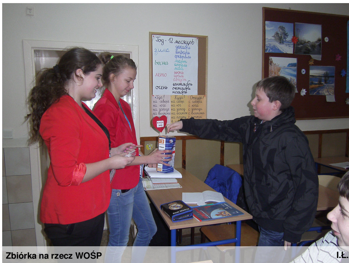
Zbiórka na rzecz WOŚP