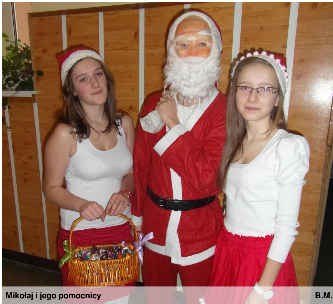
Mikołaj i jego pomocnicy