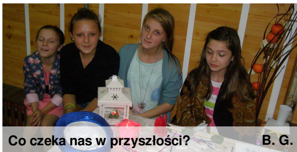
Co czeka nas w przyszłości?