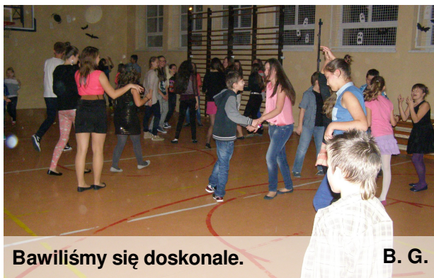
Bawiliśmy się doskonale.