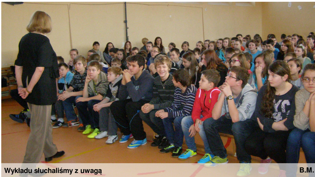
Wykładu słuchaliśmy z uwagą