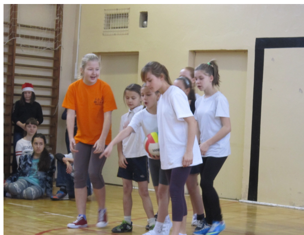
Ważna była współpraca całej drużyny