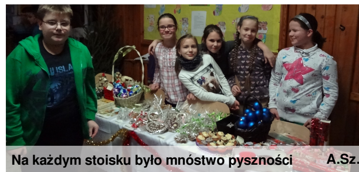
Na każdym stoisku było mnóstwo pyszności