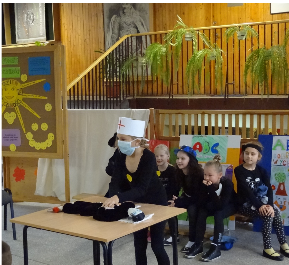
Tego dnia obejrzelśmy m.in. pantomimę