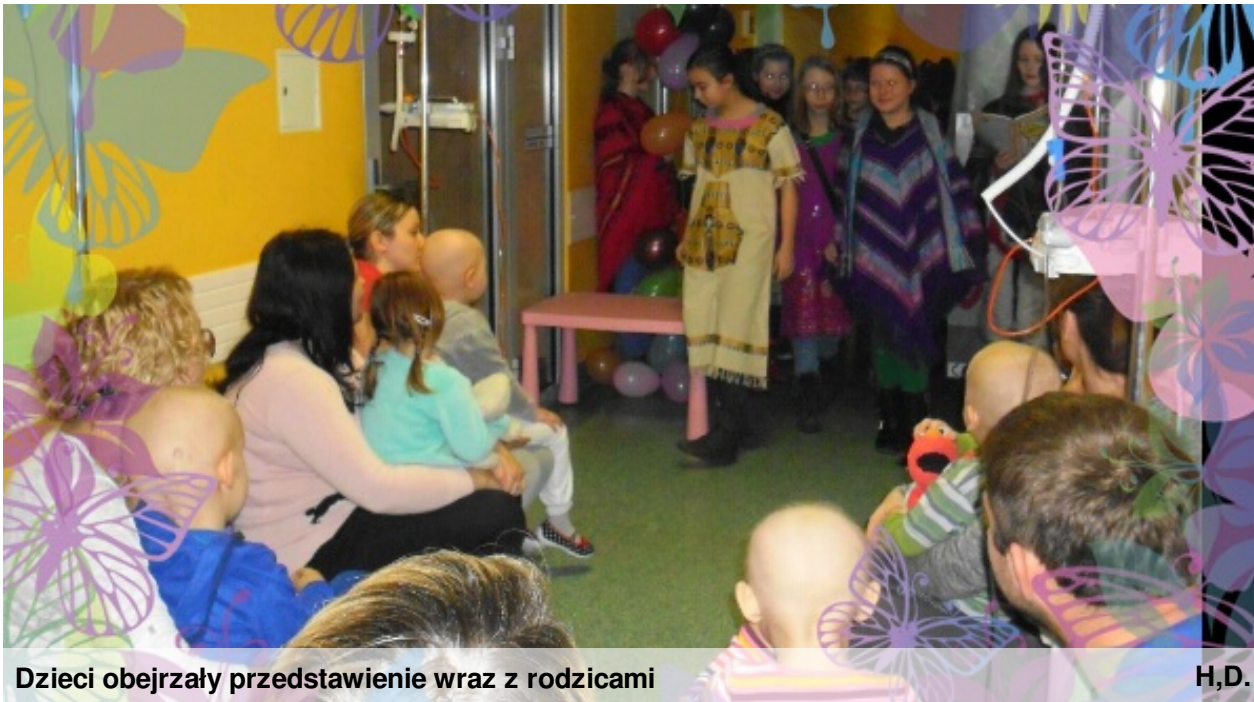
Dzieci obejrzały przedstawienie wraz z rodzicami