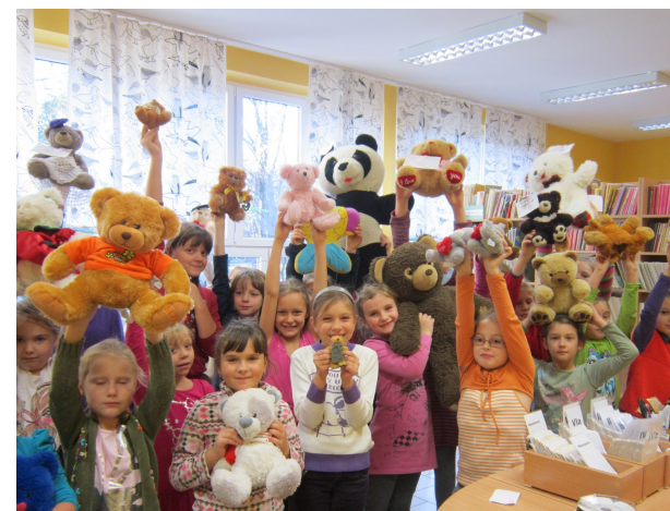
W bibliotece odbyły się różne konkursy E.K.

Jedzenie miodu na czas, konkurs na najmniejszego i najmniejszego misia, czyli Światowy Dzień Misia w szkolnej bibliotece