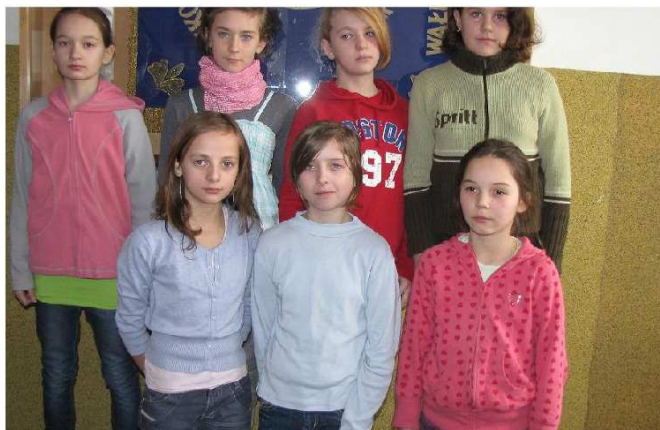
Zwycięzca drużyna z klasy V.