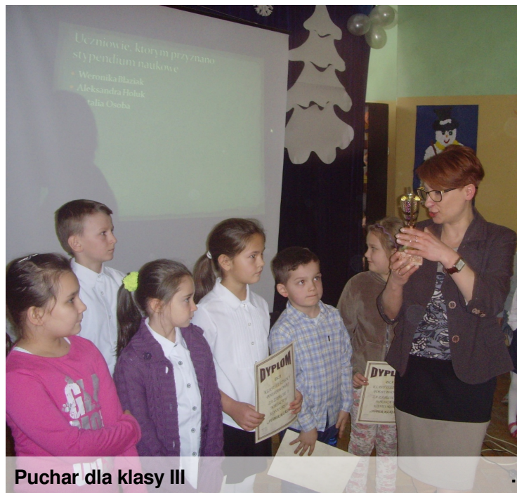
Puchar dla klasy III

W naszej szkole odbył się konkurs na super klasę w II kategoriach: klas I-III oraz IV-VI i I-III gimnazjum. W kategorii klas I-III wygrała klasa III, a w kategorii klas IV-VI i I-III gimnazjum - klasa V. Gratulujemy zwycięzcom i zachęcamy wszystkie klasy do rywalizacji w II semestrze. P@ulin@