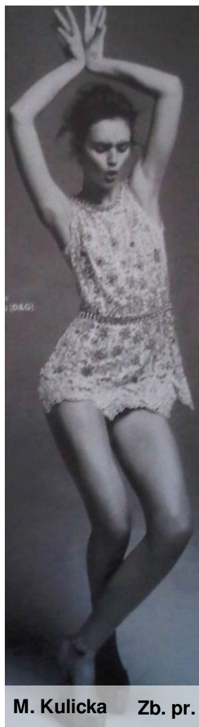
M. Kulicka Zb. pr.