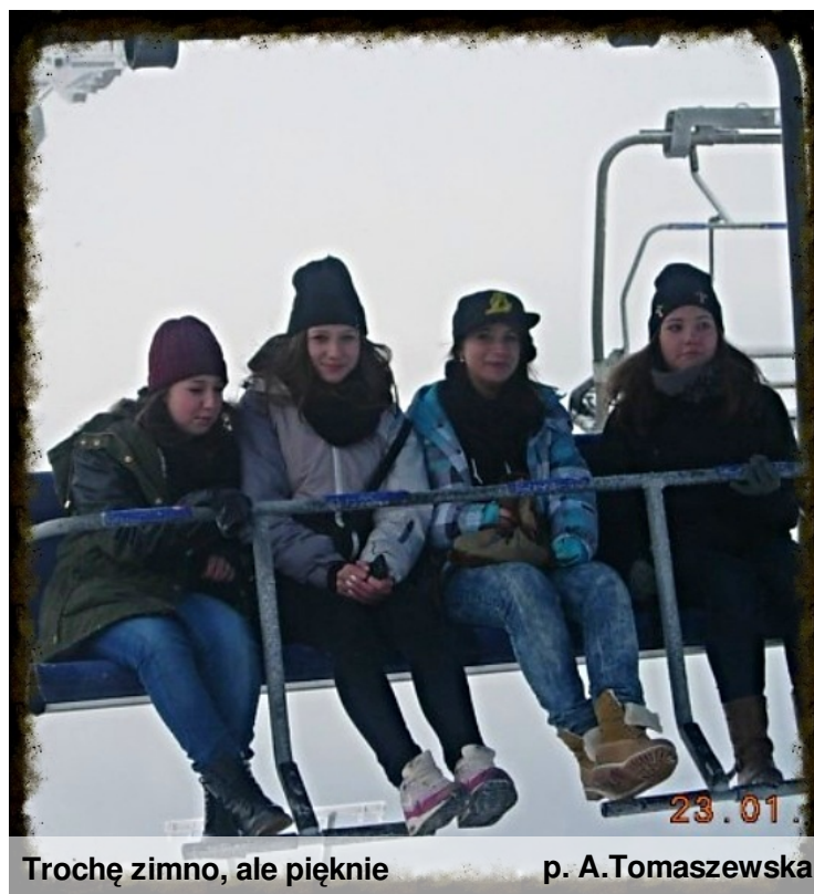
Trochę zimno, ale pięknie

W czasie ferii zimowych niektórzy z nas już po raz trzeci, w ramach zimowiska szkolnego, odwiedzili ośrodek „Orion” w Wiśle. W dniu wyjazdu każdy czuł się podekscytowany. Byliśmy w „wycieczkowym” nastroju. Jeszcze tylko pospieszne pożegnania z rodzicami, włożenie ciężkich bagaży do pociągu i już mogliśmy odjeżdżać! Wydawało nam się, że dosłownie chwilę po odjeździe, nasz pociąg zatrzymał się na stacji w Wiśle. Niestety, zima okazała się kapryśna i nawet w górach nie znaleźliśmy ani grama wymarzonego białego puchu.