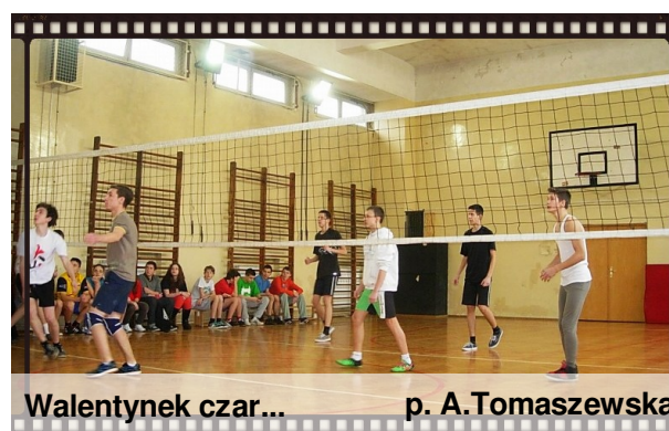
Walentynek czar...