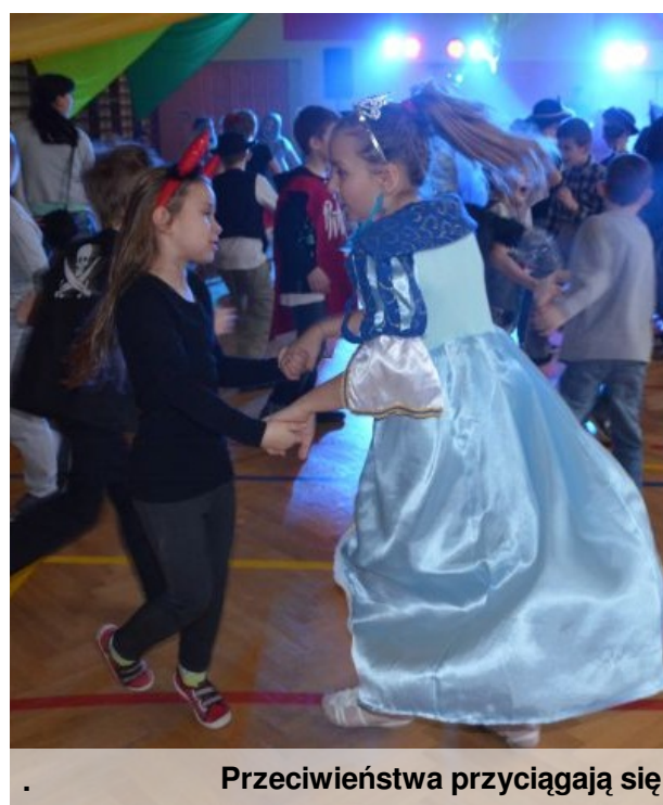
Przeciwieństwa przyciągają się