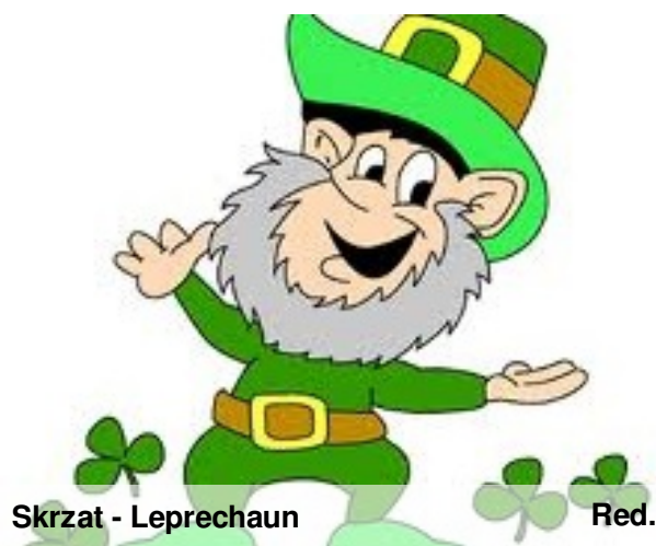
Skrzat - Leprechaun