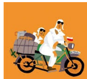
Machina przez Chiny