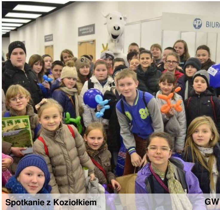
Spotkanie z Koziółkiem