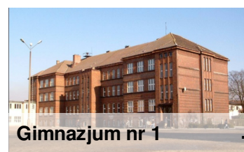
Gimnazjum nr 1

Od wielu lat uczniowie gimnazjum sprawdzając swoją wiedzę uczestniczą w konkursach przedmiotowych tzw. olimpiadach. Jest to dla nich duży wysiłek, ponieważ muszą poznać cały materiał przeznaczony dla gimnazjum z przedmiotu, który wybrali, a jednocześnie przygotowywać się do bieżących lekcji.