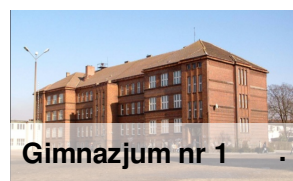
Gimnazjum nr 1