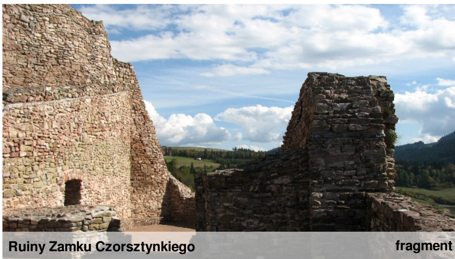
Ruiny Zamku Czorsztyńskiego