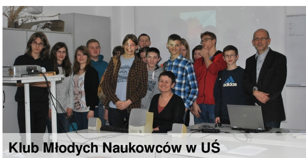
Klub Młodych Naukowców w UŚ

4 marca 2014 r. w Gimnazjum nr 2 w Ludźmierzu odbył się XIV Przegląd Twórczości Kazimierza Przerwy-Tetmajera i Twórców Podhala . Cieszy się on dużą popularnością wśród nauczycieli i młodzieży szkół podstawowych i gimnazjum z Gminy Nowy Targ, Orawy, Spisza, a nawet Krościenka n. D. Celem Konkursu było uczczenie pamięci Patrona Szkoły - piewcy Tatrzańskiej Ziemi, urodzonego w Ludźmierzu Kazimierza Przerwy-Tetmajera oraz kultywowanie tradycji i pamięci innych twórców Podhala.