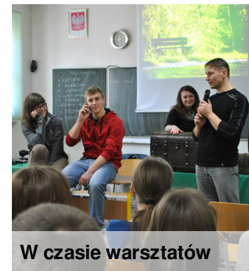
W czasie warsztatów