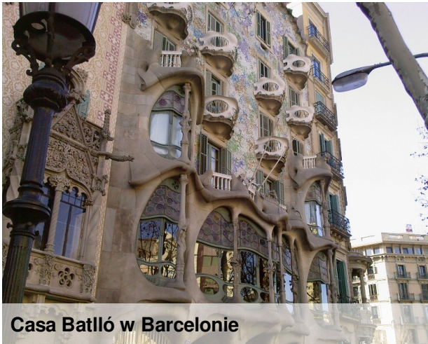
Casa Batlló w Barcelonie