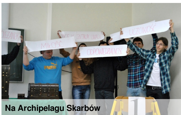
Na Archipelagu Skarbów

4 marca 2014 r. w Gimnazjum nr 2 w Ludźmierzu odbył się XIV Przegląd Twórczości Kazimierza Przerwy-Tetmajera i Twórców Podhala . Cieszy się on dużą popularnością wśród nauczycieli i młodzieży szkół podstawowych i gimnazjum z Gminy Nowy Targ, Orawy, Spisza, a nawet Krościenka n. D. Celem Konkursu było uczczenie pamięci Patrona Szkoły - piewcy Tatrzańskiej Ziemi, urodzonego w Ludźmierzu Kazimierza Przerwy-Tetmajera oraz kultywowanie tradycji i pamięci innych twórców Podhala.