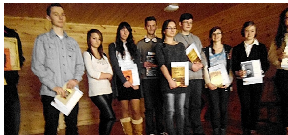
Autorzy nagrodzonych prac

Otworzyłam oczy, śledząc wapienne mury zamku. Teraz, kiedy wyłaniało się słońce, lśniły jak kryształ. Usiadłam przy jednym z okien, rozmarzonymi oczami patrząc w przestrzeń. Panowała cisza, która zdawała się opowiadać historię tego miejsca. Gdy dokładnie wsłuchałam się w nią, usłyszałam rozmowy dawnych mieszkańców. W blasku kryształowych ścian zobaczyłam kobiety