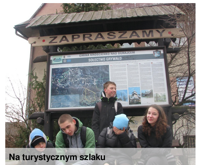
Na turystycznym szlaku

Jak zawsze towarzyszył im pies Biskopt. Ognisko i pyszne kielbaski były nagrodą po wędrowce w mało sprzyjających warunkach pogodowych. Uczestnik wyprawy