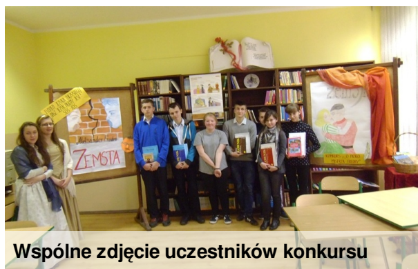
Wspólne zdjęcie uczestników konkursu

Zdobywczynie I i II miejsca zakwalifikowały się do etapu międzygimnazjalnego , który odbył się 5. 03 w Publicznym Gimnazjum im. ks. prof. Józefa Tischnera w Szczawnicy . Wzięło w nim udział po dwóch laureatów eliminacji szkolnych z gimnazjów w: Tylmanowej, Ochotnicy Dolnej, Szczawnicy i Krościenku. Czas oczekiwania na werdykt jury wypełniła szkolna grupa teatralna, bawiąc nas premierową inscenizacją fragmentów "Zemsty". Podziwialiśmy profesjonalną - choć przecież amatorską - grę aktorów oraz piękne kostiumy.