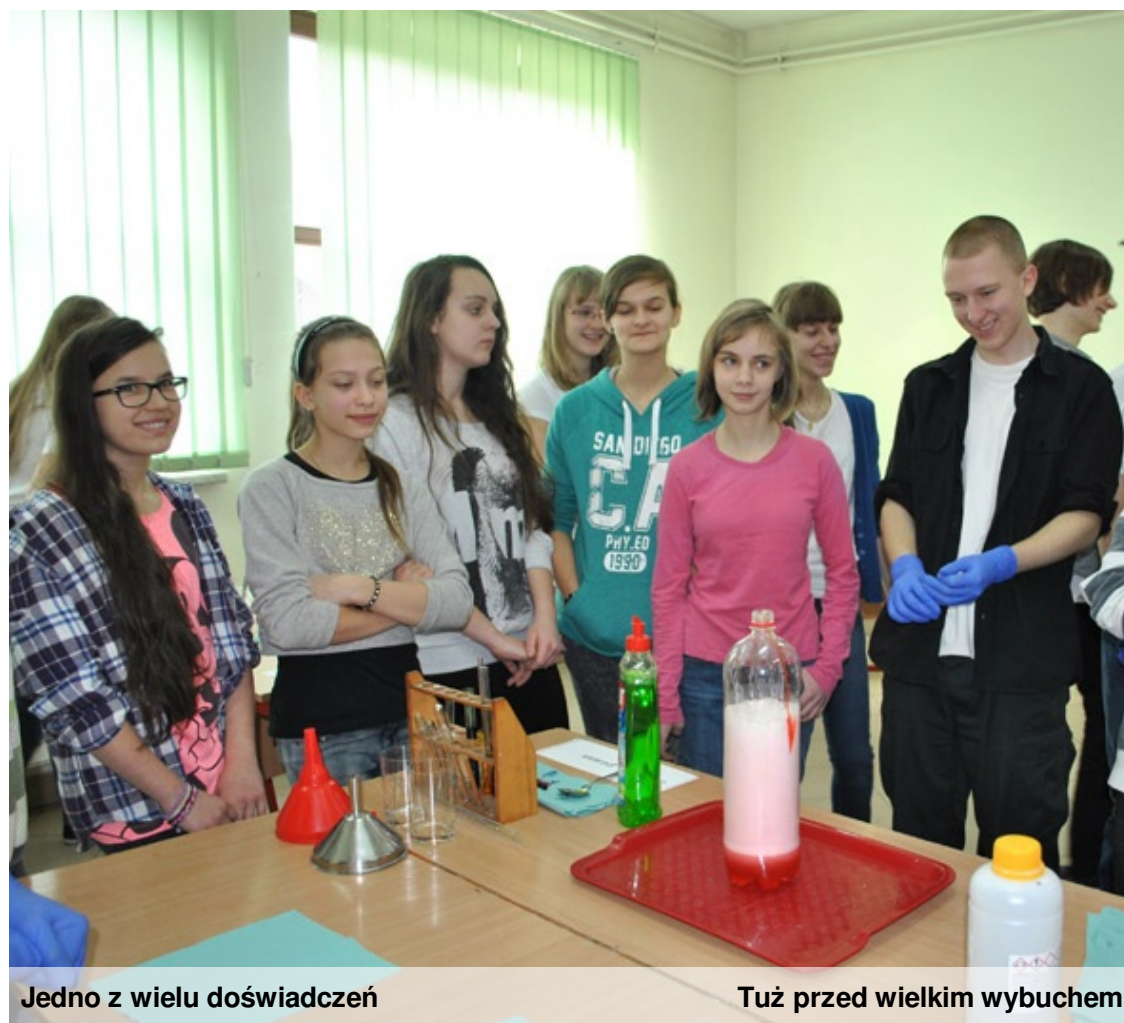
Jedno z wielu doświadczeń