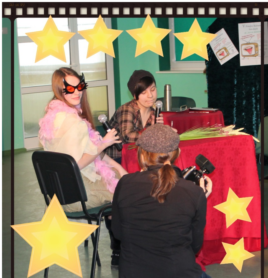
scenka kabaretowa "gwiazda"

Gimnazjum postawiło na „Język mediów” i jak się okazało zwierzęta posługują się polszczyzną lepiej od ludzi, telewizja lansuje same „słodkie idiotki”, potęga Facebooka ratuje firmy, a telewizja zajęła się edukacją młodzieży... Nie dało się powstrzymać uśmiechu, gdy na scenę wkroczyli uczniowie Zespołu Szkół obrazując otwarcie hipermarketu i przedstawiając scenkę z chińskiej restauracji.