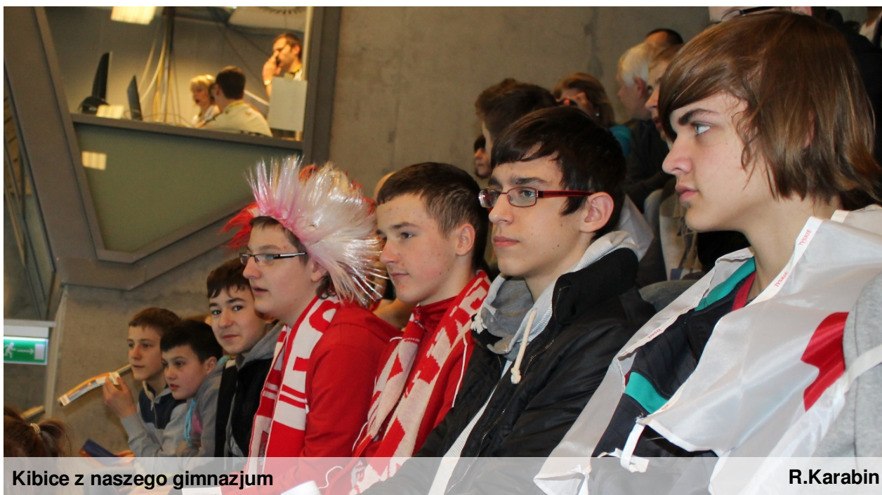
Kibice z naszego gimnazjum