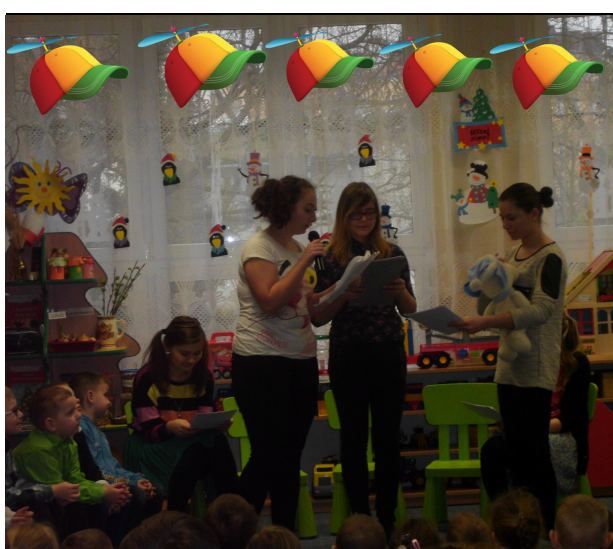
nauka o przyjaźni