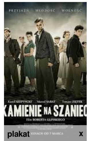
plakat KINACH OD 7 MARCA