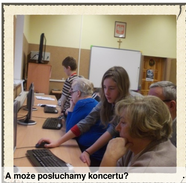
A może posłuchamy koncertu?

Mała dziewczynka stoi na ulicy i płacze. - A jak się nazywasz? - Nie wiem! - A jak się nazywa twoja mama? - Nie wiem! - A swój adres znasz? - Tak: wu-wu-wu-kropka-basia-kropka-pe-el