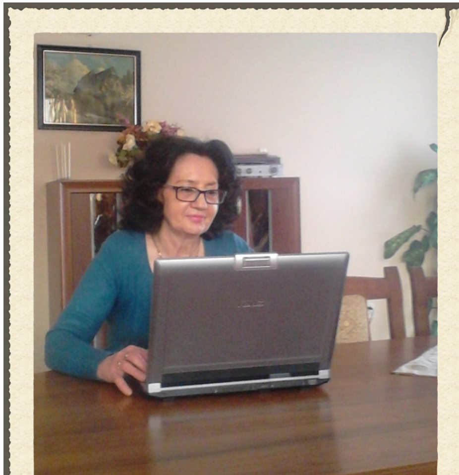
Kliku tu, kliku tam