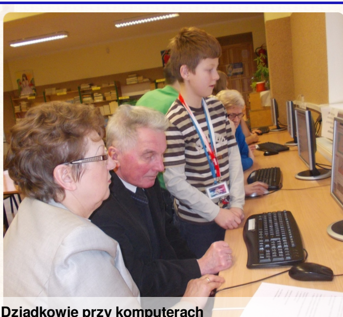
Dziadkowie przy komputerach