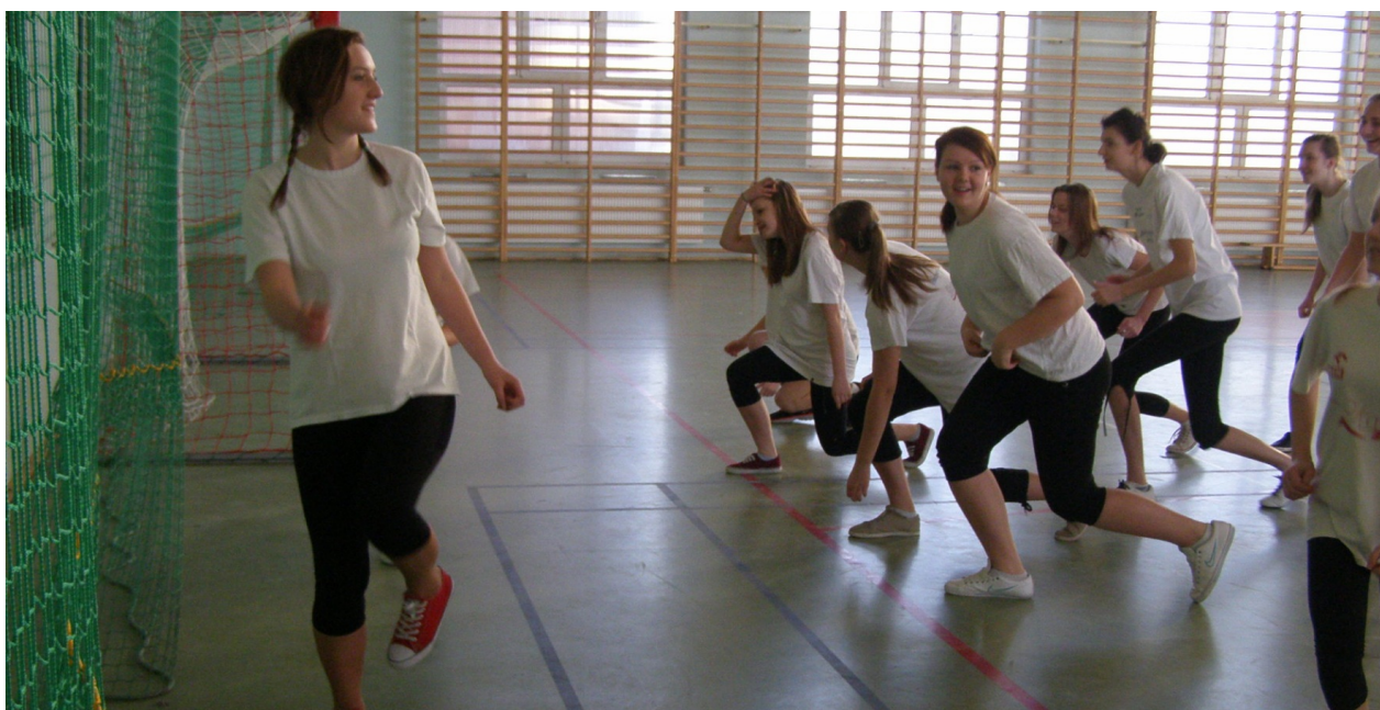
Ruch to też dobra zabawa