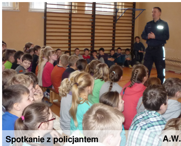
Spotkanie z policjantem