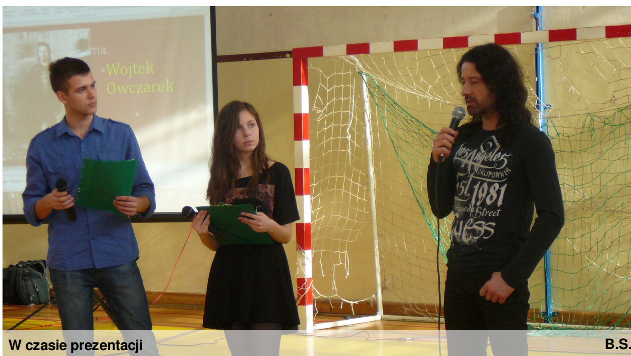
W czasie prezentacji