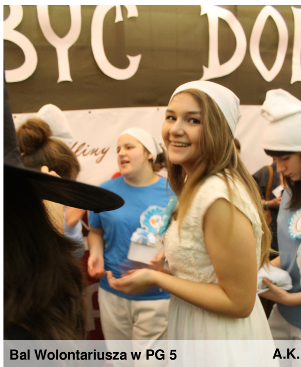
Bal Wolontariusza w PG 5