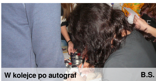
W kolejce po autograf