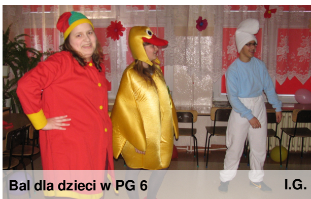
Bal dla dzieci w PG 6