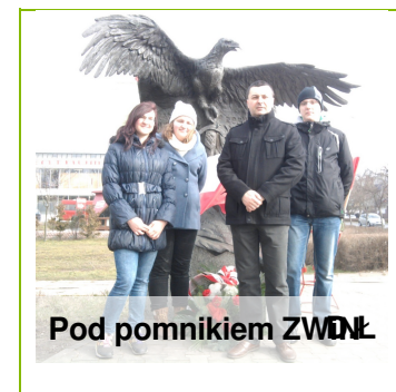
Pod pomnikiem ŻOŁNIERZY WYKŁĘCI.

Relacja z uroczystości upamiętniającej bohaterów na stronie 2.