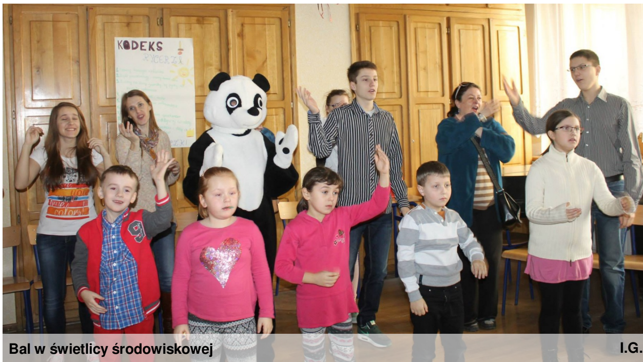
Bal w świetlicy środowiskowej