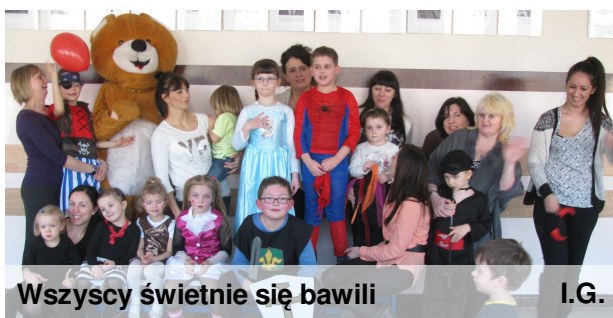
Wszyscy świetnie się bawili