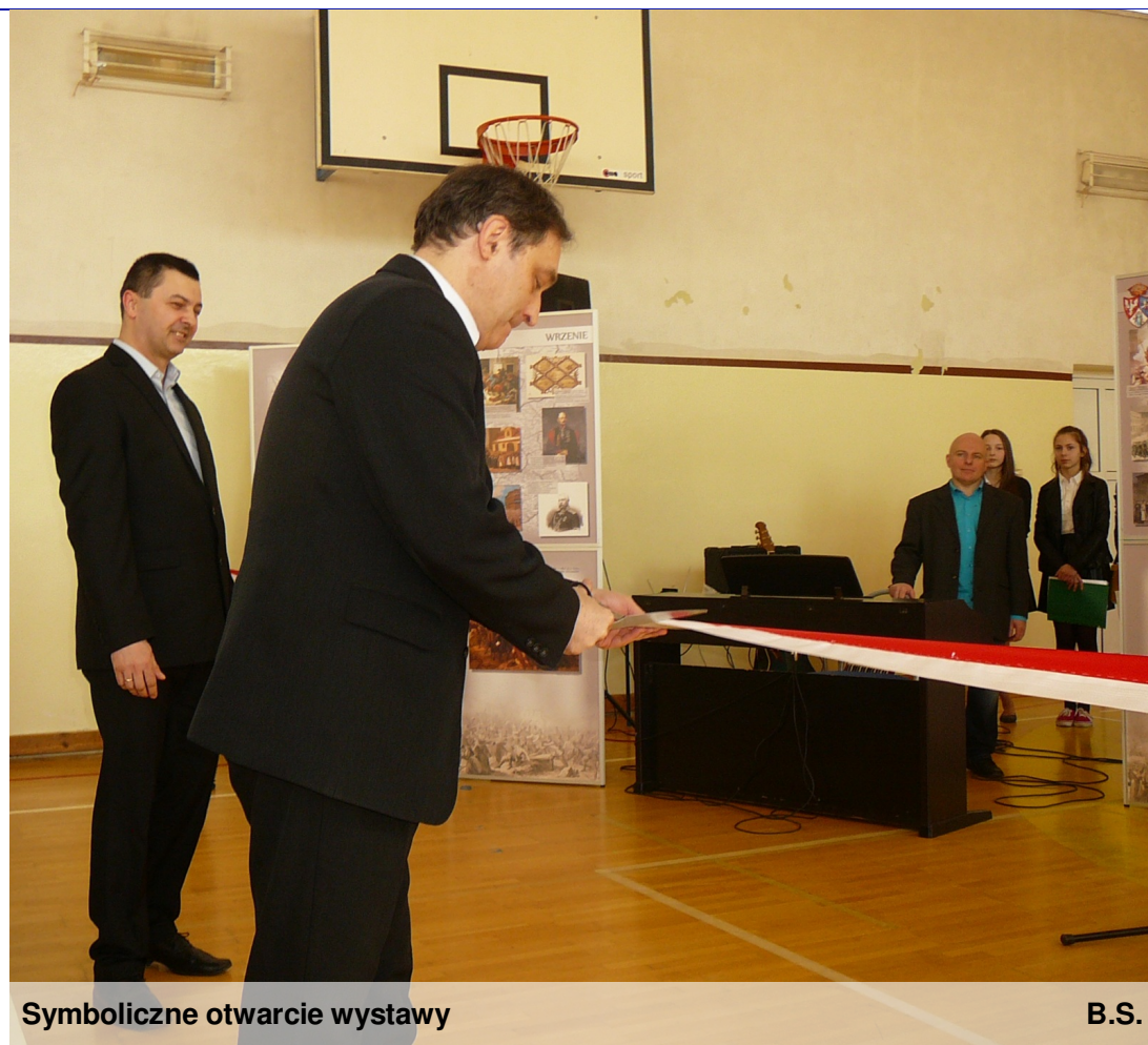
Symboliczne otwarcie wystawy